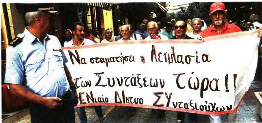
Συνταξιούχοι διαδήλωσαν χθες διαμαρτυρόμενοι για την περικοπή των συντάξεών τους έξω από το υπουργείο Εργασίας, ενώ ζήτησαν και την άμεση καταβολή των ποσών που έχουν παράνομα παρακρατηθεί