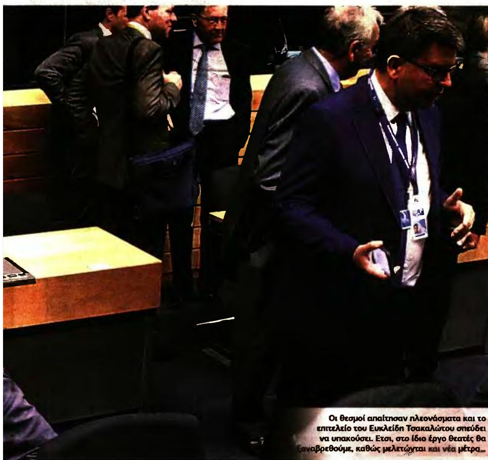
Οι θεσμοί απαίτησαν πλεονάσματα και το επετέλειο του Ευκλείδη Τσακαλώτου σπεύδει να υπακούσει. Έτσι, στο ίδιο έργο θεατές θα ξαναβρεθούμε, καθώς μελετώνται και νέα μέτρα...