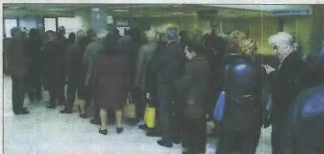
Ουρές συνταξιούχων σε τράπεζα. Η γήρανση του πληθυσμού γίνεται με ραγδαίους ρυθμούς

Ενώ την ίδια ώρα οι επιδουτούμενες από το βιομηχανικό και κερδοσκοπικό κεφάλαιο, που επιζητεί την απρόσκοπτη