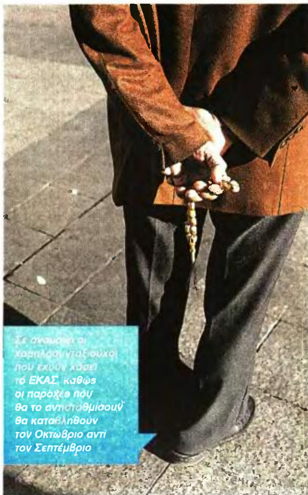
Σε σκηνή οι καρπλάσιντζι σουχ που έχουν χάσει το ΕΚΑΣ καθώς οι παροχές που θα το αντισταθμίσουν θα καταβληθούν τον Οκτώβριο αντί τον Σεπτέμβριο

Καλό Οκτώβριο οι αντισταθμιστικές παροχές σε όσους έχασαν το επίδομα