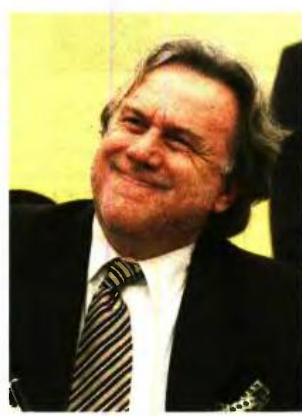
Το υπουργείο Εργασίας επιβεβαιώνει το χθεσινό πρωτοσέλιδο του «Ε.Τ.» για την επιστροφή του ΕΚΑΣ ανακοινώνοντας ότι οι πιστώσεις θα εκκινήσουν από τον Οκτώβριο για τεχνικούς λόγους.

είναι έκτακτη ενίσχυση στον έναν από τους δύο συζύγους στις περιπτώσεις που έπαιρναν ΕΚΑΣ και κόπηκε και από τους δύο, λόγω υπέρβασης του ορίου οικογενειακού εισοδήματος των 11.000 ευρώ. Η ενίσχυση θα είναι ισόποση με το ΕΚΑΣ και θα επιστραφεί στον έναν σύζυγο, αυτόν με μικρότερο ατομικό εισόδημα. Αν δηλαδή ο ένας είχε σύνταξη 400 ευρώ και έπαιρνε ΕΚΑΣ 230 ευρώ και ο άλλος είχε σύνταξη 500 ευρώ και έπαιρνε επίσης 230 ευρώ, τότε στον συνταξιούχο των 400 ευρώ θα ξαναδοθούν τα 230 ευρώ. Το ποσό βέβαια δεν θα είναι ίδιο αλλά θα ακολουθεί τις μειώσεις που θα νομοθετηθούν για το ΕΚΑΣ το 2017, το 2018, και το 2019 που καταργείται.