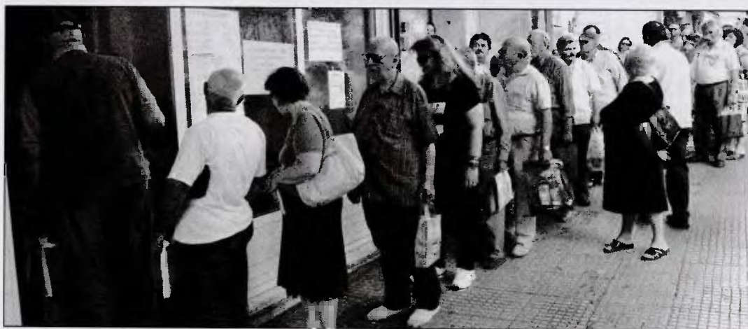
Οι αιτήσεις για τους 30 δήμους μπορούν να υποβληθούν από 15-20 Ιουλίου μέχρι τις 30 Νοεμβρίου

Οι αιτήσεις για τους 30 δήμους μπορούν να υποβληθούν από 15-20 Ιουλίου μέχρι τις 30 Νοεμβρίου. Όπως τονίζεται από το υπουργείο είναι ένα προνοιακό πρόγραμμα που απευθύνεται σε νοικοκυριά που ζουν σε συνθήκες ακραίας φτώχειας. Ο στόχος του υπουργείου είναι, αφού πρώτα εφαρμοστεί σε 30 δήμους, το 2016, από τις αρχές του 2017 να επεκταθεί στο σύνολο της χώρας.