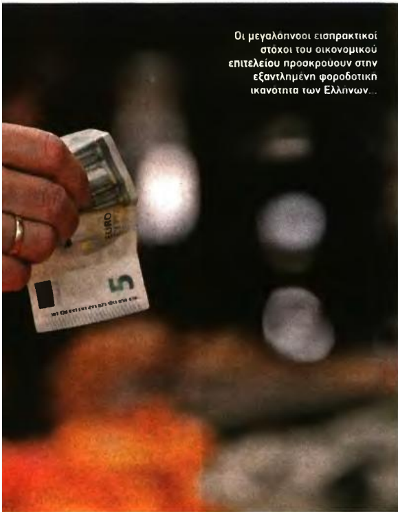
Οι μεγαλοπνοί εισπρακτικοί στόχοι του οικονομικού επιτελείου προάκρουν στην εξαντλημένη φοροδοτική ικανότητα των Ελλήνων...

● Εισόδημα από ακίνητη περιουσία. Στον υποπίνακα Δ2 του πίνακα 4 της φορολογικής δήλωσης αναγράφονται τα πάσης φύσεως εισοδήματα από ακίνητα (από εκμίσθωση ή υπεκμίσθωση ή από ιδιοχρησιμοποίηση ή δωρεάν παραχώρηση κ.λπ.). Τα συγκεκριμένα ποσά μεταφέρονται και συμπληρώνονται αυτόματα από το σύστημα TAXISnet, στους συγκεκριμένους κωδικούς, αμέσως μόλις ο φορολογούμενος ολοκληρώσει την ηλεκτρονική υποβολή του εντύπου Ε2 «αναλυτική κατάσταση για τα μισθώματα ακίνητης περιουσίας», η οποία πρέπει να προηγηθεί της υποβολής της δήλωσης Ε1.