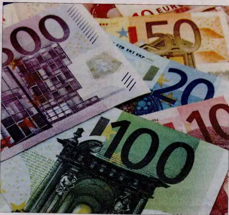
Τα ποσά του επιδόματος τέκνων από τον ΟΓΑ ποικίλλουν ανάλογα με το εισόδημα αλλά και τα μέλη της οικογένειας

Η διοίκηση του ΟΓΑ επισημαίνει ότι το συνολικό οικογενειακό εισόδημα υπολογίζεται με βάση τα τεκμήρια διαβίωσης, στην περίπτωση που αυτά είναι μεγαλύτερα των δηλωθέντων ετήσιων εισοδημάτων.