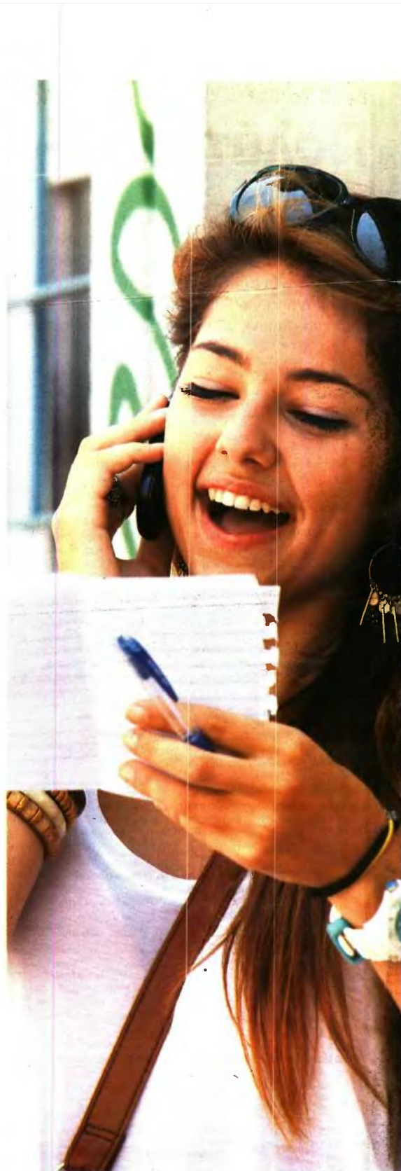
ΣΧΕΔΟΝ ΣΕ ΟΛΑ τα πεδία οι αριστούχοι αποτελούν είδος προς... εξαφάνιση, ενώ τα ποσοστά των υποψηφίων που κατέκτησαν από 0 έως 7.000 μόρια είναι εξαιρετικά υψηλά

Η λήξη της προθεσμίας ηλεκτρονικής υποβολής μηχανογραφικών δελτίων είναι η Παρασκευή 8 Ιουλίου και οι υποψήφιοι θα πρέπει να γνωρίζουν ότι, εφόσον δεν καταθέσουν το μηχανογραφικό τους, χάνουν την ευκαιρία της εισαγωγής στα ΑΕΙ.