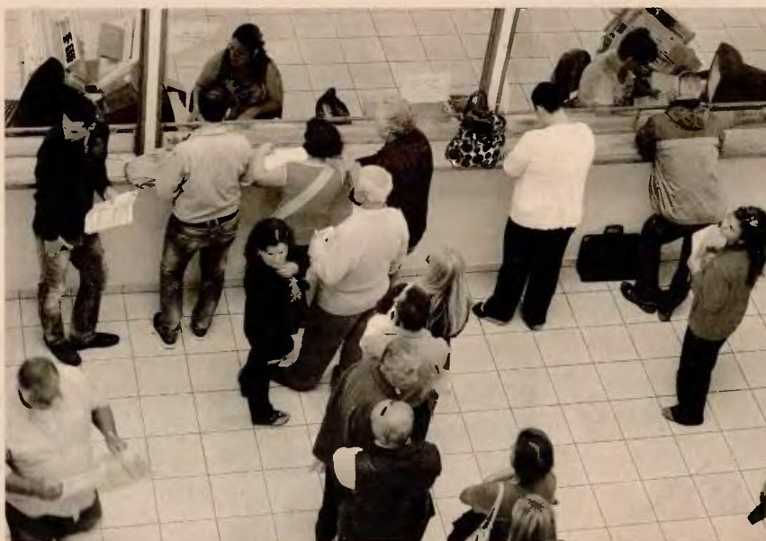
Τα φυσικά πρόσωπα που το 2015 απέκτησαν εισοδήματα πάνω από 30.000 ευρώ με την εκκαθάριση της φορολογικής τους δήλωσης θα κληθούν να πληρώσουν επιπλέον φόρους, εξαιτίας της αναδρομικής αύξησης της ειδικής εισφοράς αλληλεγγύης από την 1η Ιανουαρίου 2015.

Μετά την ψηφισι των διατάξεων θα ανοίξει τις πύλες του ηλεκτρονικού συστήματος ταξίς για την υποβολή των δηλώσεων. Στελέχη της Γενικής Γραμματείας Δημοσίων Εσόδων (ΓΤΔΕ) υπολο-