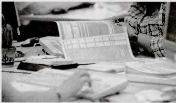
Οι κινητικά ανάπηροι με ποσοστό αναπηρίας από 80% και άνω

Η δεύτερη πρόταση προβλέπει πως ο αριθμός των μηνιαίων δόσεων τόσο για το φόρο εισοδήματος θα είναι ίσος με τον αριθμό των μηνών που θα απομένουν από το τέλος του μήνα εκκαθάρισης της