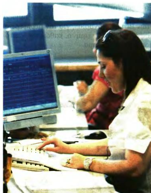
ΣΤΟΧΟΣ ΤΩΝ ΝΕΩΝ στοχευμένων αλλαγών στο ισχύον καθεστώς είναι η ενίσχυση των φορολογικών εσόδων και η διευκόλυνση των φορολογουμένων

Επισημαίνεται ότι με βάση τη σχετική εγκύκλιο του υπουργείου Οικονομικών, δυνατότητα να επανεκταχθούν στη ρύθμιση των 100 δόσεων έχουν οι φορολογούμενοι