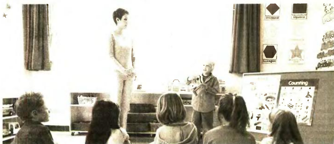
Τις θέσεις μπορούν να διεκδικήσουν γονείς που δεν έχουν λάβει το πολυπόθητο voucher, ενώ θα ακολουθηθεί η διαδικασία μοριοδότησης σε πολύτεκνες και μονογονεϊκές οικογένειες ή οικογένειες με χαμηλά εισοδήματα και ευαίσθητες κατηγορίες πολιτών.

«Φανταστείτε ότι μια οικογένεια με 14.000 ευρώ εισόδημα και παιδιά θεωρείται πλέον πλούσια και δεν πήρε voucher. Τα μόρια έκλεισαν στα 137, δηλαδή αυτός