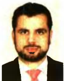
Γράφει ο Διονύσιος Ρίζος

εφαρμόστηκε στην καταβολή απύς στους τραπεζικούς λογαριασμούς των δικαιούχων. Μάλιστα σε καμία περίπτωση δεν χρησιμοποιήθηκαν συντάξιμες αποδοχές και χρόνος ασφάλισης αλλά ένας αλγόριθμος που