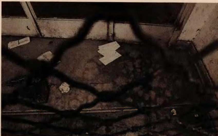
Μελέτες που βλέπουν το φως της δημοσιότητας κάνουν λόγο για αύξηση των «λουκέτων», εξέλιξη που θα οδηγήσει βαθύτερα στην ύφεση την ελληνική οικονομία.

Βέβαια, αρκετοί από αυτούς που απώλεσαν τη ρύθμιση, μπο-