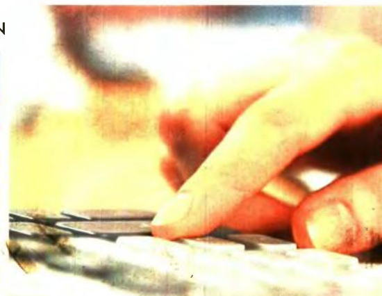
Από τους 36.053 οφειλέτες του ΚΕΑΟ που απώλεσαν τη ρύθμιση του Ν. 4321/2015 οι 3.469 έχουν υπαχθεί στην πάγια ρύθμιση.