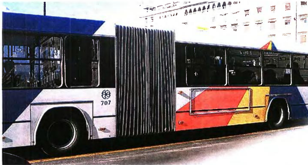
Τα αστικά λεωφορεία επανήλθαν στους δρόμους της Θεσσαλονίκης, όμως, καθώς το πρόβλημα δεν λύθηκε οριστικά, δεν αποκλείεται να τραβήξουν πάλι χειρόφρενο προς τα τέλη του χρόνου.