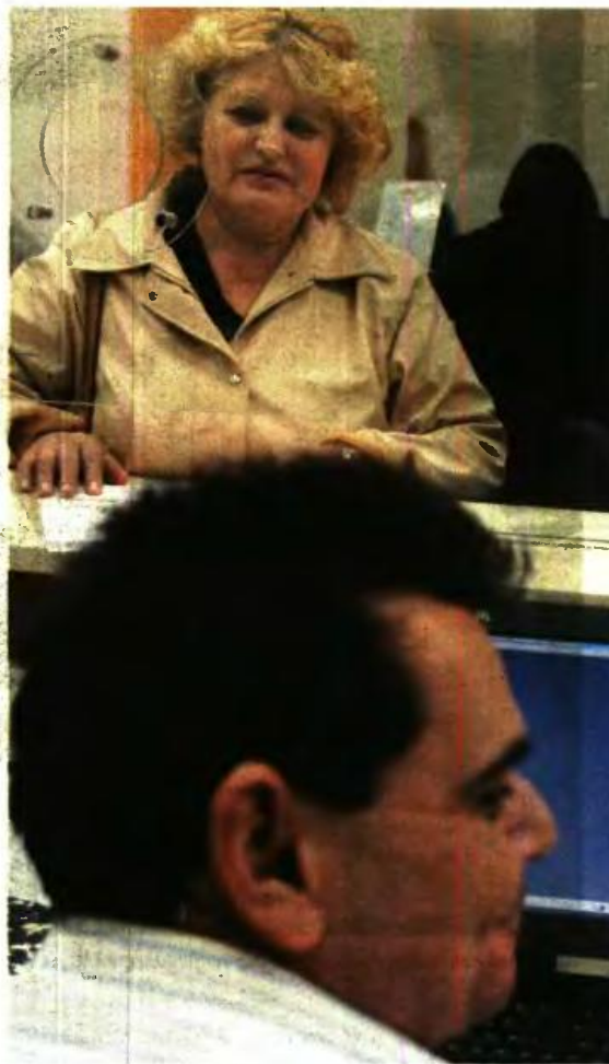
Σύμφωνα με ειδικούς, οι αλλαγές αναμένεται να είναι ευνοϊκές για μεγάλες κατηγορίες υποψήφιων συνταξιούχων

«Στους κερδισμένους ανήκουν όσοι δημόσιοι υπάλληλοι (άνδρες και γυναίκες), ασφαλισμένοι ΔΕΚΟ - τραπεζών και ΙΚΑ πρόκειται να συνταξιοδοτηθούν με τις διατάξεις των γονέων (μπτέρων - πατέρων) ανηλίκων, τριτέκνων κι έχουν