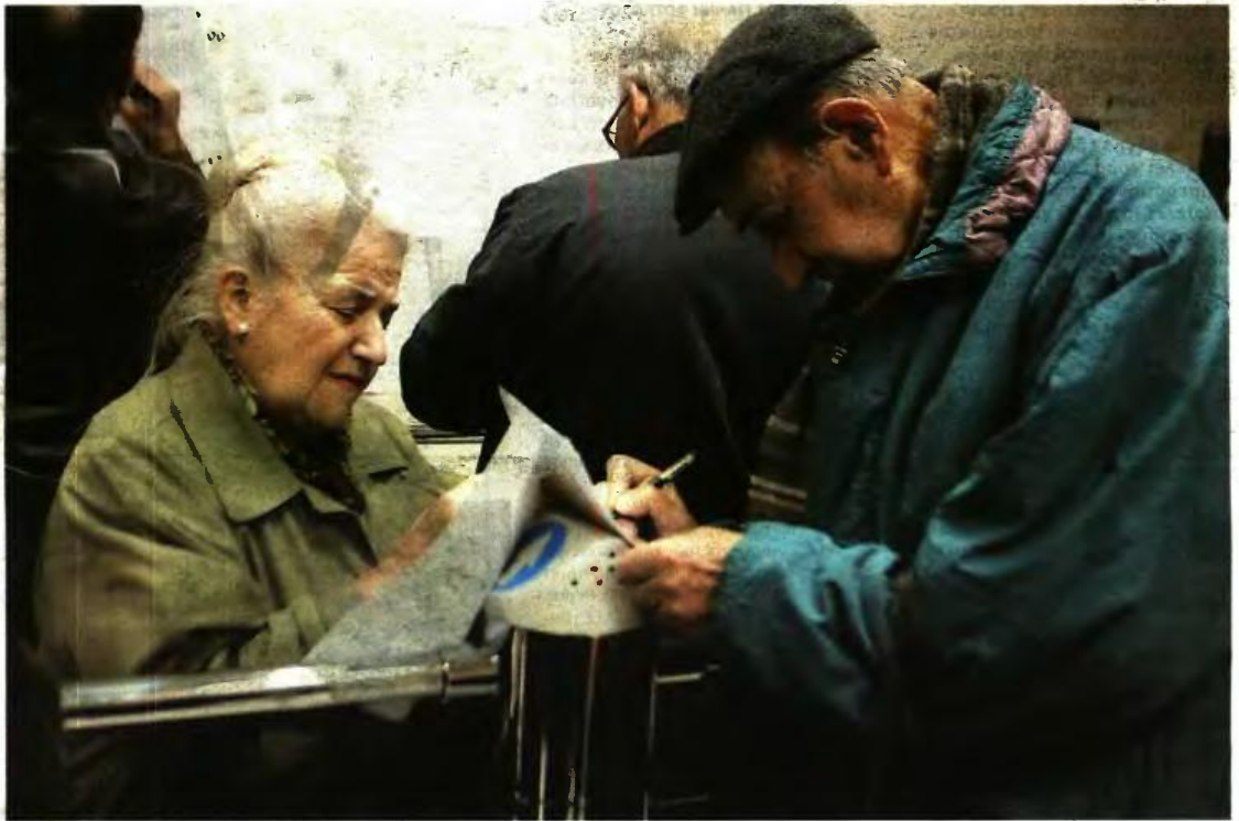
Το νέο ασφαλιστικό νομοσχέδιο φέρνει μεγάλες αλλαγές και ανατροπές σε όσα ισχύουν για τις συντάξεις χρείας

► Οι ήδη καταβαλλόμενες συντάξεις με βάση τον νόμο αναπροσαρμόζονται από 1/1/2019