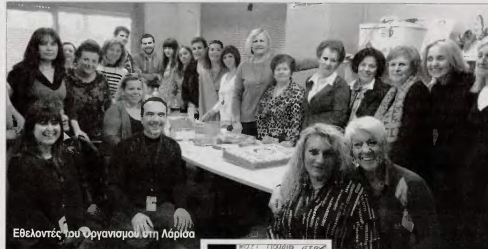
Εθελοντές του Οργανισμού στη Λάρισα

• Πληθαίνουν οι οικογένειες με προβλήματα διαβίωσης