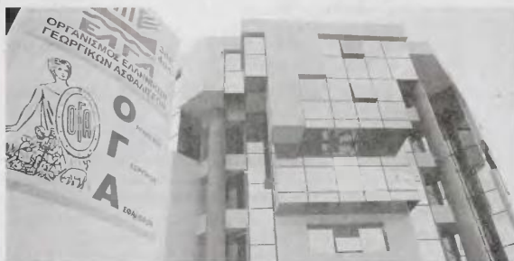
Το δείγμα καθορίζεται με απόφαση του Διοικητή του ΟΓΑ μετά από εισήγηση του Κλάδου Οικογενειακών Επιδομάτων

*Ο δικαιούχος, σε κάθε μεταβολή της οικογενειακής κατάστασής του, οφείλει εντός μηνός να υποβάλει ηλεκτρονική Αίτηση/Δήλωση Μεταβολής στη Διεύθυνση