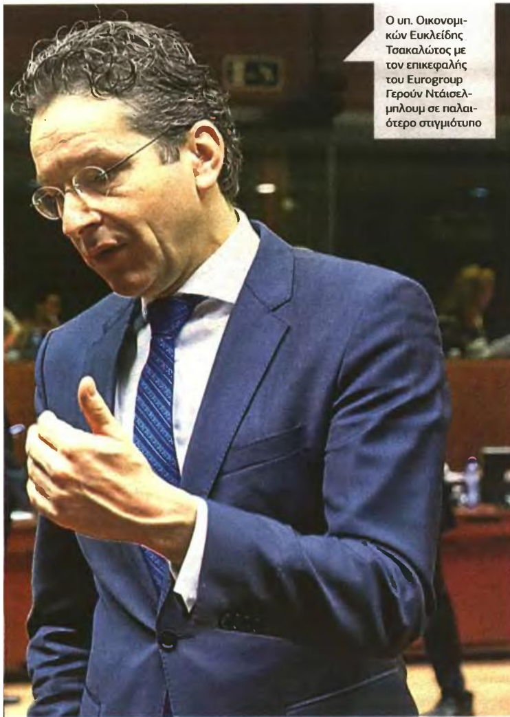
Ο υπ. Οικονομικών Ουκλείδης Τσακαλώτος με τον επικεφαλής του Ευρογρουπ Γερούν Ντσίσελμπλουμ σε παλαιότερο στιγμιότυπο

μάχη για την αποφυγή των μέτρων, που παρουσιάζονται ως «κόκκινη» γραμμή. Η κυβέρνηση θα πρέπει, τέλος, να νομοθετήσει την αλλαγή του συνδικαλιστικού νόμου, αλλά και τον τρόπο με τον οποίο λαμβάνονται οι αποφάσεις από τα συνδικάτα για τις απεργίες. Σύμφωνα με τα όσα έχει ζητήσει το «κουαρτέτο», το υπουργείο Εργασίας θα πρέπει να νομοθετήσει ότι για την κήρυξη απεργίας θα απαιτείται η ψήφος του 50% +1% όλων των μελών των πρωτοβάθμιων συνδικαλιστικών σωματείων.