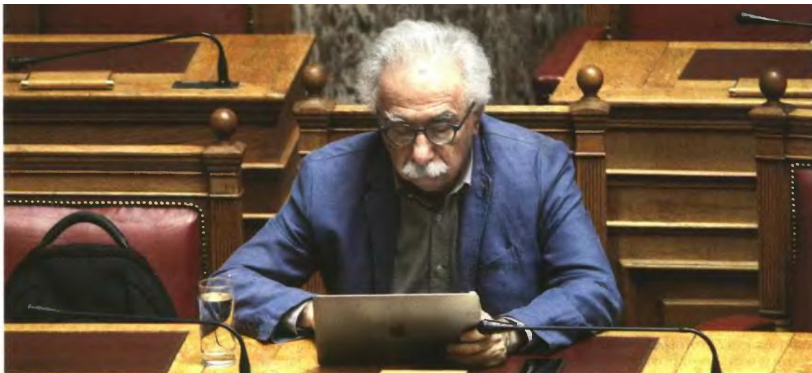
Ο υπουργός Παιδείας Κώστας Γαβρόγλου στα έδρανα της Βουλής