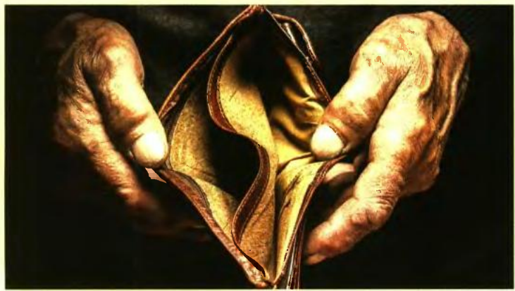
Ποσά προ φόρου και εισφοράς ασθένειας.