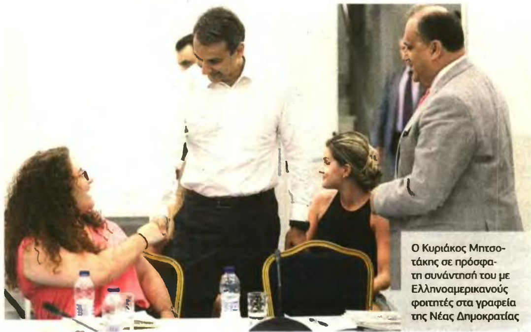
Ο Κυριάκος Μητσοτάκης σε πρόσφατη συνάντησή του με Ελληνοαμερικανούς φοιτητές στα γραφεία της Νέας Δημοκρατίας

Στη συνέχεια του άρθρου του, ο κ. Μητσοτάκης ασκεί κριτική στην κυβέρνηση κάνοντας λόγο για «ιδεολογικές αγκυλώσεις» και «στείρο κομματισμό». Ειδικότερα, ο πρόεδρος της ΝΔ, αφού υποστηρίζει ότι πρέπει «να αποβληθεί ο κρα-