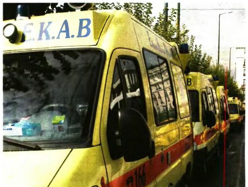
Οι υποψήφιοι για τις θέσεις στο ΕΚΑΒ πρέπει να διαθέτουν Δίπλωμα Επαγγελματικής Κατάρτισης της ειδικότητας «Πλήρωμα Ασθενοφόρου-Διασώστης» του ΙΕΚ ΕΚΑΒ ή αντίστοιχης ειδικότητας

ΤΕ Νοσηλευτικής: Πτυχίο ή δίπλωμα τμήματος Νοσηλευτικής Τ.Ε.Ι. ή το ομώνυμο πτυχίο ή δίπλωμα Π.Σ.Ε. (Τ.Ε.Ι.) ή αντίστοιχο κατά ειδικότητα πτυχίο ή δίπλωμα Τ.Ε.Ι. ή Π.Σ.Ε. (Τ.Ε.Ι.) της ημεδαπής ή ισότιμος και αντίστοιχος τίτλος της ημεδαπής ή αλλοδαπής ή το ομώνυμο ή αντίστοιχο κατά ειδικότητα πτυχίο Κ.Α.Τ.Ε.Ε. ή ισότιμος και αντίστοιχος τίτλος της ημεδαπής ή αλλοδαπής.