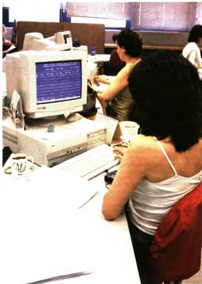
Η ΔΗΛΩΣΗ της εθελούσιας αποκάλυψης εισοδημάτων αφορά τον φόρο εισοδήματος, τον ΦΠΑ, τον φόρο μεταβίβασης ακινήτων, τον ΕΝΦΙΑ και την εισφορά αλληλεγγύης

Χρήση των διατάξεων μπορούν να κάνουν και οι φορολογούμενοι για τους οποίους έχει εκδοθεί εντολή ελέγχου ή έχει ζητηθεί παροχή πληροφοριών, έως την 31.5.2017. Η καταβολή της οφειλής που προκύπτει από την οικειοθελή αποκάλυψη εισοδημάτων γίνεται είτε εφάπαξ σε 30 ημέρες από την υποβολή της δήλωσης είτε μέσω ρύθμισης τμηματικής καταβολής. ●