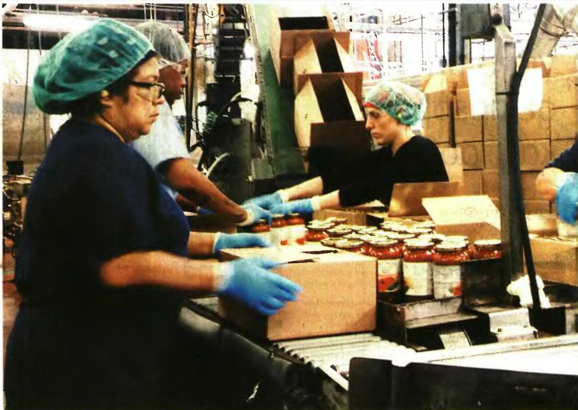
Κτίρια, εγκαταστάσεις, μηχανήματα και εξοπλισμός είναι ανάμεσα στις δαπάνες που χρηματοδοτούνται στις επιχειρήσεις

Η περίοδος υποβολής των προτάσεων είναι από τις 17 Μαρτίου έως τις