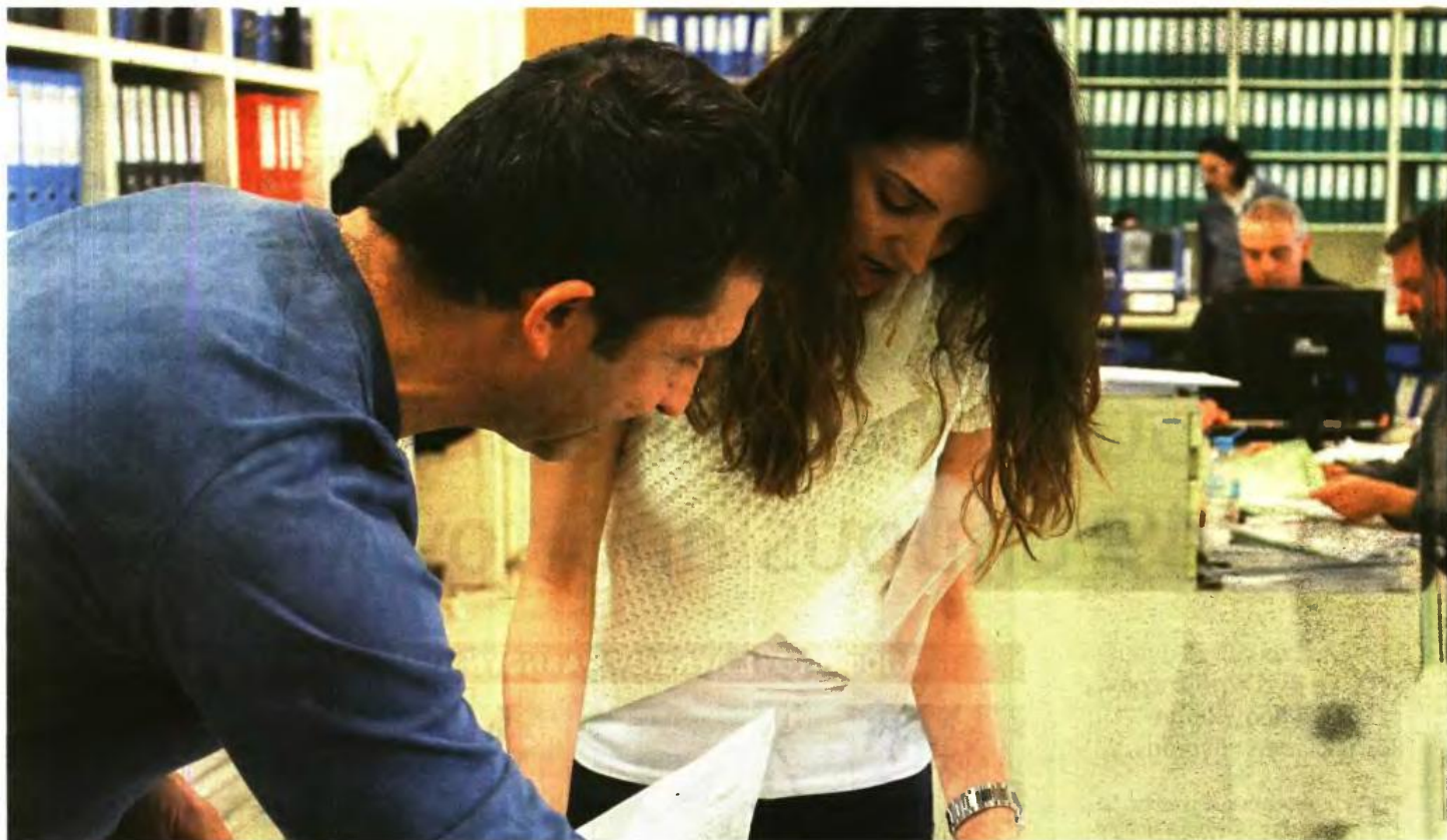
Η αμοιβή του προγράμματος κοινωνικού εργασιών θα ανέρχεται στα 495,25 ευρώ τον μήνα για τους ανέργους άνω των 25 ετών και στα 431,75 ευρώ για τους κάτω των 25 ετών