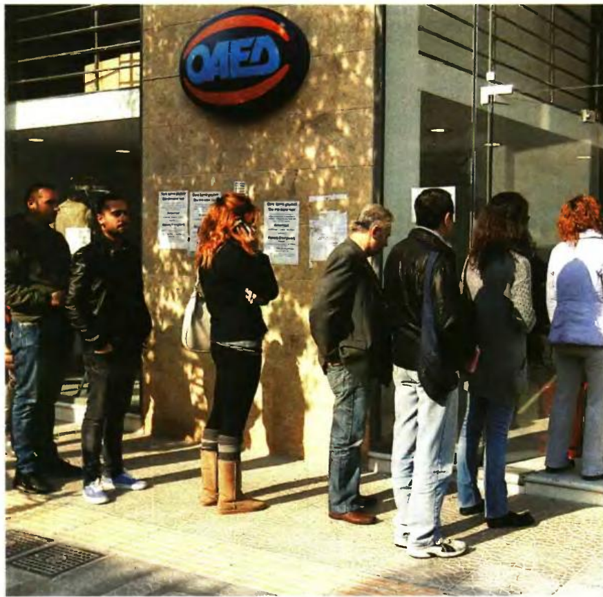
Πρώτη κατηγορία δικαιούχων του προγράμματος είναι οι άνεργοι πτυχιούχοι Τριτοβάθμιας Εκπαίδευσης, εγγεγραμμένοι στα μητρώα του ΟΑΕΔ κατά την ημερομηνία υποβολής της αίτησης

■ Και για τις δύο κατηγορίες δικαιούχων (Α': Άνεργοι και Β': Αυτοαπασχολούμενοι) το συνολικό δηλωθέν εισόδημα για το φορολογικό έτος 2015 θα πρέπει να μην υπερβαίνει, ανάλογα με την οικογενειακή τους κατάσταση, τις 20.000 ευρώ για το ατομικό εισόδημα ή τις 35.000 ευρώ για το οικογενειακό εισόδημα. Επιχειρήσεις που δραστηριοποιούνται στο λιανικό ή χονδρικό εμπόριο είναι επιλέξιμες για τη Δράση;