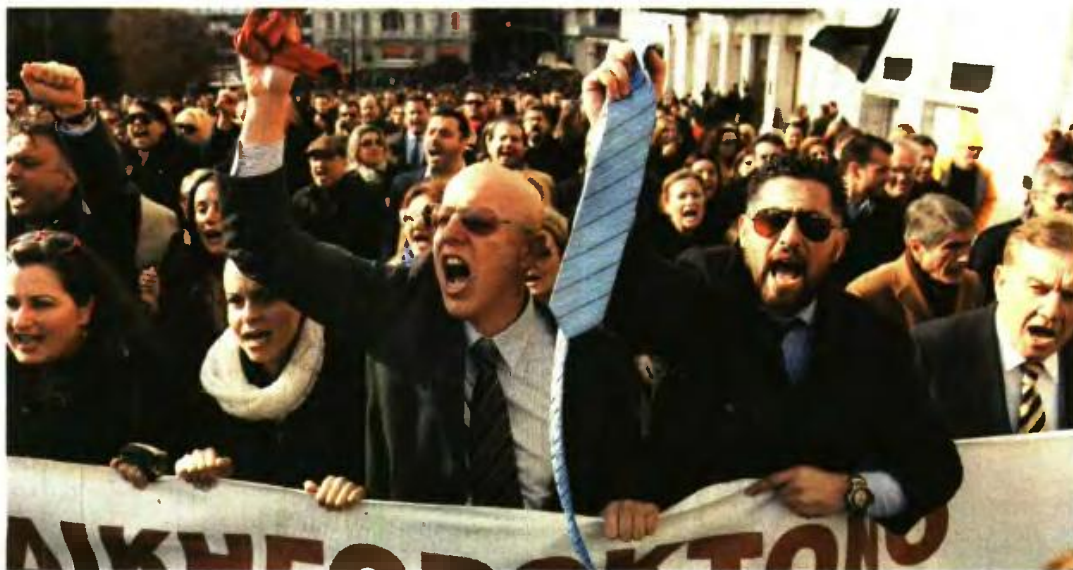
ΣΕ ΣΕΙΡΑ ΚΙΝΗΤΟΠΟΙΗΣΕΩΝ για το Ασφαλιστικό κατεβαίνουν όλοι οι επιστημονικοί φορείς

Σήμερα το πρωί επρόκειτο να πραγματοποιήσουν συγκέντρωση διαμαρτυρίας έξω από τα γραφεία της Γενικής Γραμματείας Πληροφοριακών Συστημάτων στο Μοσχάτο (Χανδρή 1 και