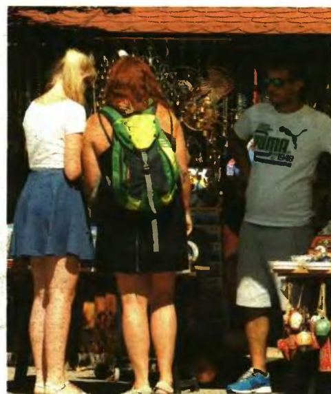
Με το πρόγραμμα του ΕΣΠΑ ενισχύονται οι υφιστάμενες και νέες μεσαίες, μικρές και πολύ μικρές επιχειρήσεις που δραστηριοποιούνται στον τουρισμό

-Υφιστάμενες επιχειρήσεις είναι εκείνες που έχουν δύο ή περισσότερες πλήρεις διαιριστικές χρήσεις. Σε επιχειρήσεις με τρεις ή περισσότερες χρήσεις απαιτείται η επιχείρηση να απασχολεί κατά μέσο όρο την τριετία 2013-2015 τουλάχιστον μισή ΕΜΕ μισθωτής εργασίας. Σε επιχειρήσεις με δύο χρήσεις απαιτείται, κατ' αναλογία, η επι-