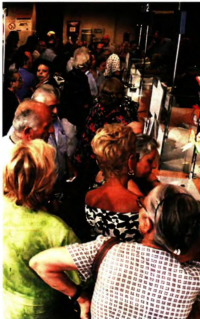
Μέσα στο 2016 και το 2017, η συνολική περικοπή που έγινε στο ΕΚΑΣ ανήλθε στα 570 εκατ. ευρώ. Με τη νέα μείωση το συνολικό ποσό που θα κοπεί από τους χαμηλοσυνταξιούχους θα φτάσει τα 800 εκατ.

Η μείωση και στον προϋπολογισμό των αντισταθμιστικών μέτρων σημαίνει -εκτός απρόπου- ότι οι μόνοι που θα εξακολουθήσουν να παίρνουν ενίσχυση ίση με το ΕΚΑΣ που έχασαν ή θα χάσουν το 2018 είναι οι συνταξιούχοι με αναπηρία 80% και άνω, καθώς και ο ένας εκ των δύο συζύγων που είναι δικαιούχοι σήμερα και δεν θα είναι δικαιούχοι το 2018. Στις περιπτώσεις συζύγων το όριο οικογενειακού εισοδήματος για το 2017 είναι 11.000 ευρώ προκειμένου να πάρουν ΕΚΑΣ. Αν με τα νέα κριτήρια μειωθεί το όριο οικογενειακού εισοδήματος και πάει στις 9.000 ευρώ, τότε μόνο στην περίπτωση που χάσουν το επίδομα και οι δύο θα πάρει ενίσχυση ίση με το ΕΚΑΣ που κόπηκε ο σύζυγος που έχει το χαμηλότερο ατομικό εισόδημα από σύνταξη. Για να δοθεί όμως η ενίσχυση στο σύζυγο με το μικρότερο εισόδημα θα πρέπει ο ίδιος να πληροί το νέο όριο ατομικού εισοδήματος που θα τεθεί για το 2018. Αν