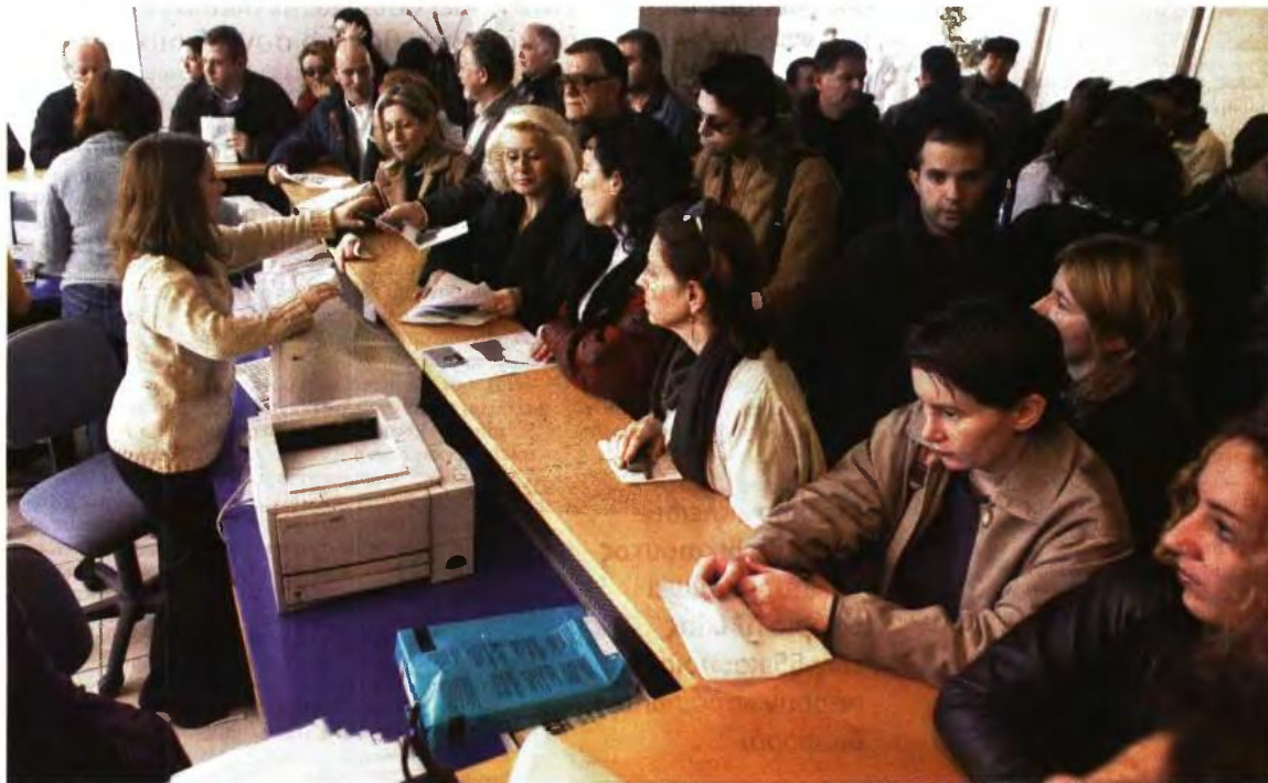
Τα πάνω - κάτω φέρνουν στο Συνταξιοδοτικό τέσσερις ρυθμίσεις που ψηφίστηκαν τα προηγούμενα χρόνια και μπαίνουν σταδιακά σε ισχύ

2 Αύξηση των ασφαλιστικών εισφορών για 100.000 με 150.000 μισθωτούς που έχουν