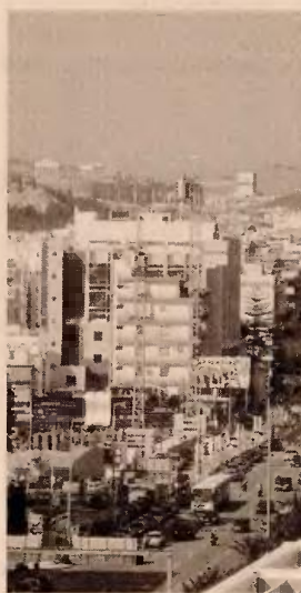
Τα ξενοδοχεία και συνολικά ο κλάδος του τουρισμού παραμένουν στο επίκεντρο για τις ΑΕΕΑΠ.

Οι φοιτητικές κατοικίες είναι από τις πλέον δυναμικά αναπτυσσόμενες αγορές στον κλάδο των ακινήτων διεθνώς, καθώς καταγράφονται σημαντικές ελλείψεις και ταυτόχρονα μεγάλη ζήτηση για παροχή από ιδιώτες οργανωμένων υπηρεσιών στέγασης προς φοιτητές. Στην Ελλάδα, δεδομένης