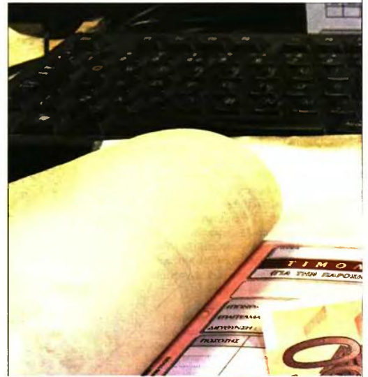
ΠΟΣΑ ΘΑ ΠΑΙΡΝΕΙ ΤΟ ΔΗΜΟΣΙΟ

Εν τω μεταξύ, υποχώρωση εισφορές έχουν πλέον και: ■ Τα μέλη ή μέτοχοι οργανισμών, κοινοπραξιών ή κάθε μορφής εταιριών, πλην των ανωνύμων και των ιδιωτικών κεφαλαιουχικών, των