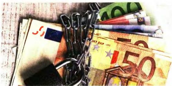
Η σύνταξη με 35 έτη στο Δημόσιο

του 2017 για 35 έτη στο Δημόσιο θα είναι 1.025 ευρώ. Όσοι φύγουν το 2018 θα πάρουν το 25% της μείωσης ως προσωπική διαφορά, δηλαδή από τα 363 της αρχικής περικοπής θα έχουν απώλεια 272 ευρώ και τα 91 ευρώ θα καταβάλλονται ως προσωπική διαφορά που ανά πάσα στιγμή μπορεί να καταργηθεί. Η σύνταξη με έξοδο το 2018 θα είναι 995 ευρώ. Όσοι φύγουν από το 2019 και μετά δεν θα έχουν καμία προσωπική διαφορά και θα υπολογιστεί ολόκληρη η μείωση, δηλαδή -363 ευρώ και σύνταξη 904 ευρώ. Δεν προστατεύονται από την προσωπική διαφορά όσοι έχουν μείωση μέχρι 19,99%, καθώς επιβαρύνονται εξαρχώς με όλο το ποσοστό μείωσης. Έτσι υπάλληλος με 29 έτη που θα έπαιρνε 1.004 με το παλιό καθεστώς και 818 με το νέο τρόπο έχει μείωση 19% και τη φορτώνεται εξαρχώς, χωρίς καμία προσωπική διαφορά.