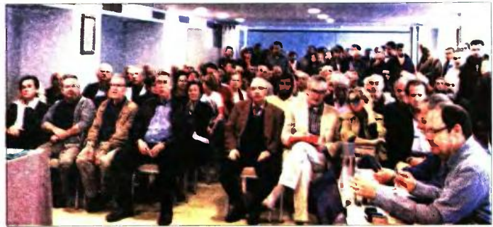
Κατάμεστη η αίθουσα στη γενική συνέλευση. Οι κάτοικοι εναντιώνας ζητούσαν να μείνουν οι γραμμές στο λιμάνι και την ΒΙΠΕ.

παραμένει η ξεκάθαρη θέση του ΚΚΕ για περιμετρική διέλευση της σιδηροδρομικής γραμμής από την Πατρα με καθετή συνδεδεση της με το λιμάνι και την ΒΙΠΕ», ανέφερε