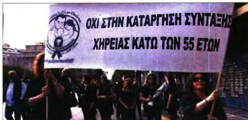
Από παλαιότερη διαμαρτυρία χηρών για τον νόμο Κατρούγκαλου