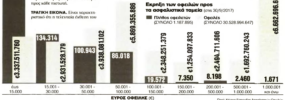
Εκρηξη των οφειλών προς τα ασφαλιστικά ταμεία (στις 30/9/2017)