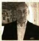
Γράφει ο ΓΙΑΝΝΗΣ ΒΑΣΙΛΑΚΟΠΟΥΛΟΣ

Το να σπέρνεις ταξικό μίσος δεν μπορεί να αποτελέσει τη βάση καμιάς υγιούς – και πά- ντως όχι μακρόχρονης – μεταρρύθμισης. Ο χώ- ρος της παιδείας, ειδικά, είναι λεπτός και έχει συγκεκριμένη ιδιοσυσστασία που, αν δεν την λάβεις υπόψη σου, καταχωρίζεσαι στους απο-