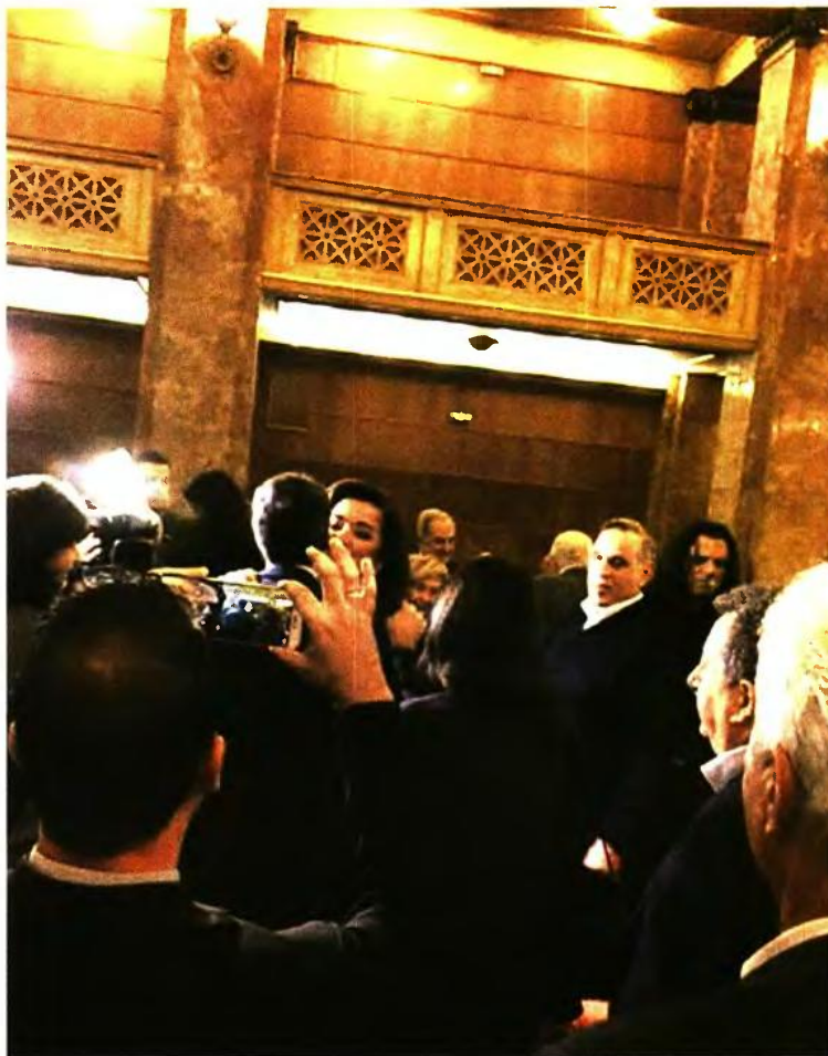
Δημόσιος ασπασμός Κυριάκου Μητσοτάκη - Ντόρας Μπακογιάννη

Προς επιρρωσιν των προαναφερθέντων, οι δυο τους συνομίλησαν τηλεφωνικά, σύμφωνα με πληροφορίες, προ της χθεσινής εκδήλωσης, που στόχο είχε την εκπλήρωση μίας εκ των τελευταίων επιθυμιών του Κωνσταντίνου Μητσοτάκη. Πρόσωπα που είναι σε θέση να γνωρίζουν το παρασκήνιο επιμένουν, εξάλ-