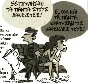
ΤΟΥ ΚΩΣΤΑ ΣΚΛΑΒΕΝΤΗΤΗ

Ανάλογη θα είναι η τοποθέτηση του Πρωθυπουργού στη σημερινή ομιλία του από το Περιφερειακό Αναπτυξιακό Συνέδριο της Κέρκυρας.