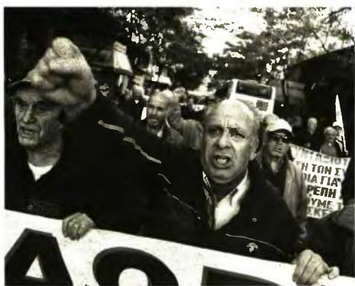
Μετά το νέο ψαλίδισμα το 2021, ένας στους δύο συνταξιούχους θα παίρνει σύνταξη €550

νυπολογισμού φτάνουν στο 30%, ιδίως για τις γυναίκες με 25ετία. 2. Μικρότερες έως 30% είναι οι νέες συντάξεις που εκδίδονται με βάση τον νόμο Κατρούγκαλου, δηλαδή όσες λαμβάνουν οι απούντες συνταξιούχοι από τις 13 Μαΐου του 2016 και μετά. Συνολικά έως το 2020 περίπου 200.000 ασφαλισμένοι που θα αποχωρήσουν από την εργασία τους θα υποστούν περικοπές που σε ορισμένες περιπτώσεις θα αγγίζουν το 30%. Η μέση μείωση εκτιμάται στο 12% με 16% για τους νέους συνταξιούχους. 3. Πάνω από 140.000 χαμηλοσυνταξιούχοι θα δουν νέα περικοπή στο ΕΚΑΣ το 2018, καθώς κόβονται άλλα 238 εκατ. ευρώ από το επίδομα και θα πληρωθούν μόλις 85 εκατ. ευρώ για όσους συνεχίσουν να το λαμβάνουν και την επόμενη χρονιά. Οι δικαιούχοι σήμερα είναι περίπου 210.000, ενώ το 2018