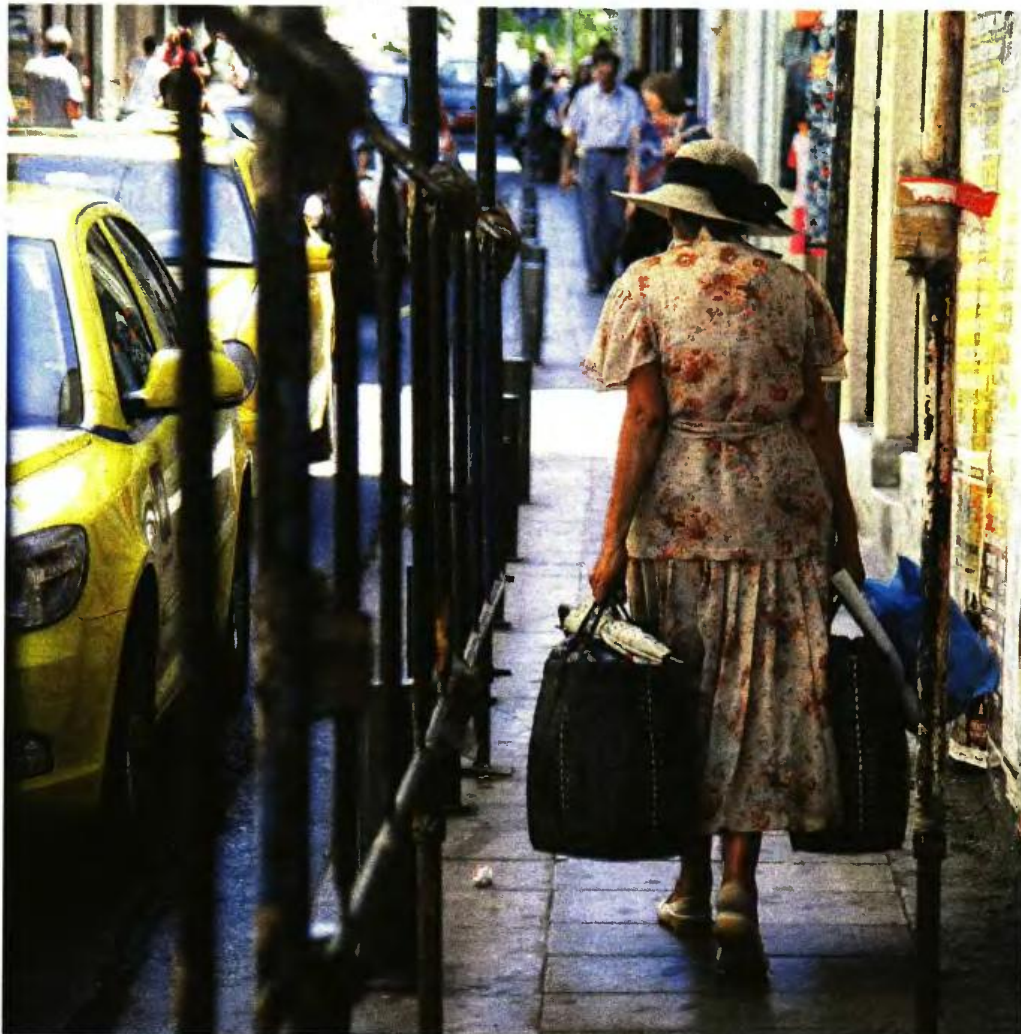
Το ποσοστό των ατόμων σε κίνδυνο φτώχειας ή κοινωνικού αποκλεισμού αυξήθηκε κατά οκτώ μονάδες την περίοδο 2007-2016, σύμφωνα με την έρευνα.