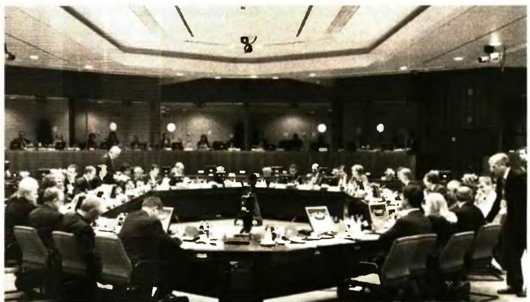
Το Eurogroup συνεδρίασε χθες και ενέκρινε την τεχνική συμφωνία με τους θεσμούς

Κατά τον Μοσκοβισί, η τεχνική συμφωνία είναι ένα ενθαρρυντικό μήνυμα και πολύ καλά νέα εν όψει της ολοκλήρωσης του προγράμματος σε λι-