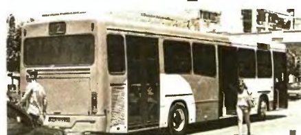
Δεν θα έχουμε αναστάτωση στην εξυπηρέτηση του κοινού σήμερα, κατά τα φαινόμενα

πανών (καύσιμα), η μείωση της κίνησης και η περικοπή των αποζημιώσεων στη μεταφορά μαθητών, η δωρεάν μετακίνηση ΑΜΕΑ και πολιτών έχει καταστήσει ασύμφορη την εκμετάλλευση» αναφέρει τέλος για το ΚΤΕΛ η διοίκησή του, τονίζοντας ότι οι ιδιοκτήτες έχουν επωμιστεί το κόστος, καθώς «οι μειώσεις αποδοχών δεν ξεπερνούν ποσοστά της τάξης του 5 - 10%». Το Εργατοπαλλακτικό Κέντρο Πάτρας ανακοίνωσε, πάντως, ότι «στηρίζει τον αγώνα και τα δίκαια αιτήματα των εργαζομένων στα Αστικά και Υπεραστικά ΚΤΕΛ». ΚΑΝΟΝΙΚΑ ΚΑΙ ΤΟ ΑΣΤΙΚΟ Στο μεταξύ, κανονικά θα γίνουν σήμερα και τα δρομολόγια του Αστικού ΚΤΕΛ της Πάτρας, σε αντίθεση με άλλα, τα οποία, όπως έχει ανακοι-