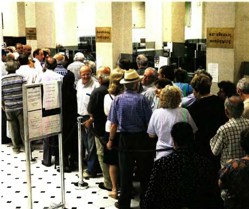
Μπαράξ κατασχέσεων σε εισοδήματα και καταθέσεις αλλά και φοροκυνηγτό προβλέπει το επιχειρησιακό σχέδιο της ΑΑΔΕ για το 2018.

ΓΙΩΡΓΟΣ ΠΑΛΑΙΤΣΑΚΗΣ gpalaitsakis@e-typos.com