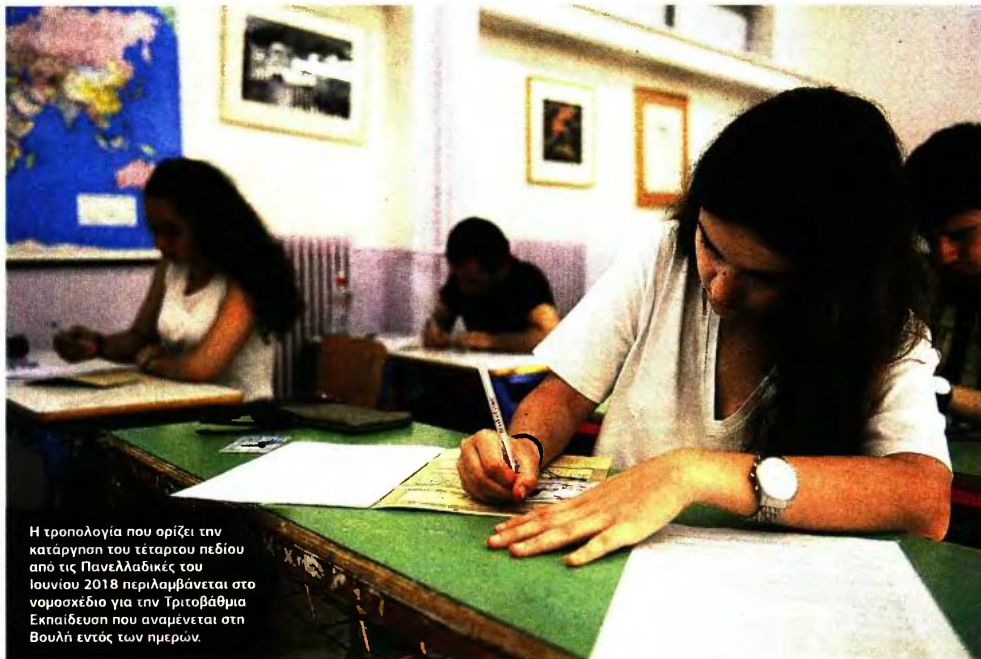
Η τροπολογία που ορίζει την κατάργηση του τέταρτου πεδίου από τις Πανελλαδικές του Ιουνίου 2018 περιλαμβάνεται στο νομοσχέδιο για την Τριτοβάθμια Εκπαίδευση που αναμένεται στη Βουλή εντός των ημερών.