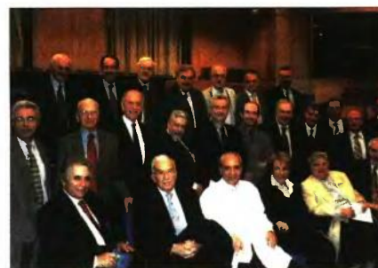
Στο Αμφιθέατρο του Αρεταίειου, με άλλους καθηγητές

προσκοπούν είναι διαφορετικά: η πρώτη ασχολείται πνευματικά με τον Δημιουργό, η δεύτερη με τα δημιουργήματά Του. Δεύτερον, ότι το χειρουργικό αποτέλεσμα, ως ανθρώπινο, είναι σχετικό, το θείο είναι απόλυτο. Όταν καθίσταται μάρτυς νέος ασθενής, με μια απλή επέμβαση, να πεθαίνει και άλλος, με επέμβαση 10-15 ωρών ή επί ξή μίνες στη Μονάδα Εντατικής Θεραπείας, με τεχνητή διατήρηση καρδιάς, πνευμόνων, νεφρών, να γίνεται καλά και να έρχεται πεζός να μας κάνει επίσκεψη, τι θα μπορούσα να προσθέσω περισσότερο; Ποτέ δεν λέω στον άρρωστό μου για οποιαδή-