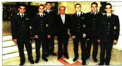
Με αξιοματικώς της Σχολής Ικάρων σε εκδήλωση

Μας γράφει (η επιστολή, διαβέσμη): «Νοσηλεύτηκα επί έξι μήνες στον Ευαγγελισμό, με διευθυντή της κλινικής τον καρδιολόγο και πατέρα του προηγούμενου πρωθυπουργού Αντ. Σαμαρά. Εκεί με είδαν επισκέπτες, φίλοι καθηγητές του διευθυντού από την Αμερική, Αγγλία, Γαλλία και Ιταλία, οι δε δύο Αμερικανοί μου είπαν ότι, και στην Αμερική να σε πάρουμε, θα σου κόψουμε το πόδι. Νοσηλεύτηκα δύο φορές στο Λαϊκό Νοσοκομείο, από δύο μήνες κάθε φορά, και μου είπαν το ίδιο. Κατά τη νοσηλεία μου τη δεύτερη φορά στο Λαϊκό πέρασε ένας καλός ανθρωπάκος που πουλούσε χριστιανικά βιβλία και μου είπε να πάρω να διαβάσω τον βίο του Αγίου Νεκταρίου. Εγώ του απάντησα: "Δεν μας παρατάς, άνθρωπέ μου, δεν πιστεύω ποτέ να". Και εκείνος μου είπε: "Εσύ είσαι καλός άνθρωπος, δεν έχεις κακιά ψυχή". Με κοίταξε στα μάτια και εγώ συνεχίζα να του μιλάω άσχημα και να τον διώχνω. Μετά από λίγο μετάνιωσα και, βλέποντας μια κοπέλα δίπλα μου, της είπα να τρέξει να φωνάζει