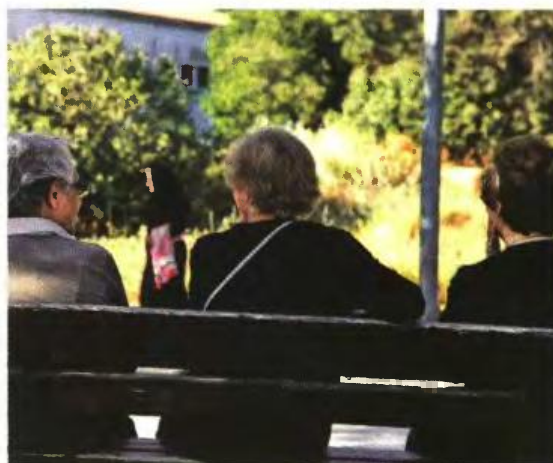
Αν η χήρα παίρνει και δική της σύνταξη ή αν εργάζεται τότε ο νόμος λέει ότι μετά την πρώτη τριετία (εφόσον είναι άνω των 55) το 50% της σύνταξης θα γίνεται 25%.

Ενας ασφαλισμένος που βγαίνει στη σύνταξη με αναπηρία 65% και είχε εργαστεί για 10 χρόνια με μέσο μισθό 700 ευρώ, θα πάρει 192 ευρώ από την εθνική σύνταξη και μόλις 54 ευρώ ανταποδοτική σύνταξη για τα 10 χρόνια, δηλαδή η συνολική του σύνταξη θα είναι 246 ευρώ και δεν θα αλλάξει ποτέ παρά μόνον αν καταργηθεί ο νόμος που έφεραν ΣΥΡΙΖΑ και Κατρούγκαλος.