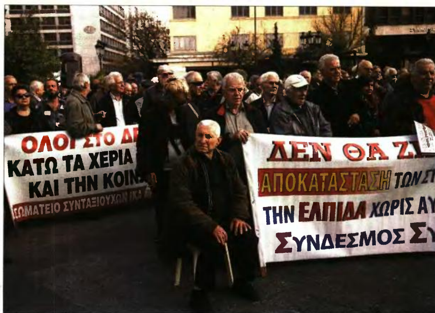
Η συγκέντρωση των συνταξιούχων χθες το πρωί στην πλατεία Κοτζιά, λίγο πριν από την πορεία προς το υπουργείο Εργασίας

Ανάμεσα στα αιτήματα των συνταξιούχων, τα οποία έχουν αποστείλει και στην υπουργό Εργασίας Εφη Αχτσιόγλου, είναι να παραμείνουν ακέραιες οι κύριες και οι επικουρικές συντάξεις, το ΕΚΑΣ και τα μερίσματα, να επανέλθουν η