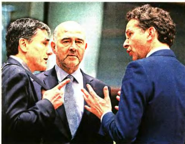
Οι Έλληνες υπουργοί είχαν χθες επαφές στις Βρυξέλλες, μεταξύ άλλων, με τον επίτροπο Πιερ Μοσκοβισί και τον πρόεδρο του Eurogroup Γερούν Ντάισελμπλουμ (φωτογραφία αρχείου)

Μεταμεσονύχτιο παζάρι με τους δανειστές για τα μέτρα που θα περιλαμβάνει το επικαιροποιημένο Μνημόνιο είχε η ελληνική διαπραγματευτική ομάδα -η οποία εκτός απροόπτου επιστρέφει σήμερα από τις Βρυξέλλες-, στοχεύοντας σε ένα προσχέδιο τεχνικής συμφωνίας ως το μεθαυριανό Eurogroup στη Βαλέτα της Μάλτας. Πρόκειται για το «πακέτο» παρεμβάσεων σε φορολογικό, ασφαλιστικό, εργασιακό και ενέργεια που θα επιβληθούν από το 2019, πλην όμως η κυβέρνηση θα πρέπει να το ψη-