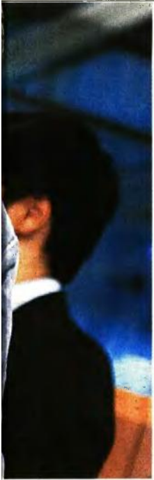
Πιερ Μοσκοβισί - Ευκλείδης Τσακαλώτος. Ο γάλλος επίτροπος έστειλε μήνυμα στην Αθήνα

Ακόμα και αν η κυβέρνηση συμβιβαστεί στον νέο γύρο επαφών στις Βρυξέλλες, δεδομένου ότι το ΔΝΤ δεν έχει δώσει ένδειξη ότι θα κάνει πίσω στην απαίτηση για βαθύ μαχαίρι στις συντάξεις και το αφορολόγητο το 2019, οι καθυστερήσεις έχουν κοστίζει ήδη ακριβά. Παραφράζοντας την «πρόοδο επί της πρόοδου», οι καθυστερήσεις επί των καθυστερήσεων αν δεν ανατραπούν, φέρνουν στο προσκήνιο δύσκολες ημέρες του 2015.