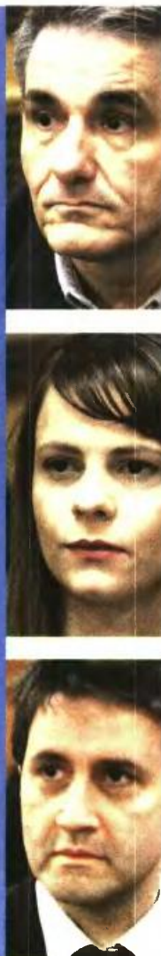
Αριστερά: Ο Αλέξης Τσίπρας με την Ανγκελα Μέρκελ. Δεξιά από επάνω: Ο Ευκλείδης Τσακαλώτος, η Εφη Αχτσιόγλου και ο Γιώργος Χουλιαράκης