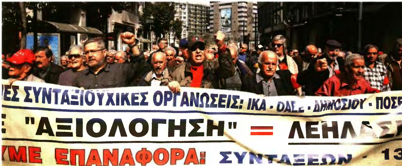
ΕΥΡΩΚΙΝΗΣΗ ΓΕΩΡΓΙΑΣ ΜΠΙΝΑΚΗ