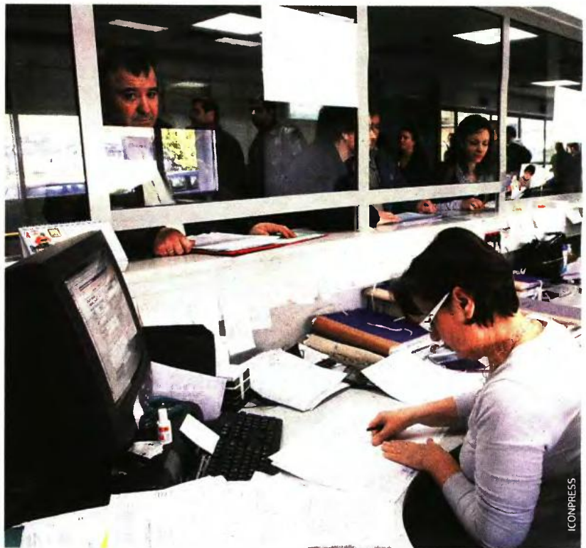
Νέες επιβαρύνσεις επιφυλάσσει φέτος η εφορία σε μισθωτούς και συνταξιούχους για τα εισοδήματα του 2017.

Κάθε μισθωτός και συνταξιούχος, για να δικαιούται έκπτωσης φόρου, θα