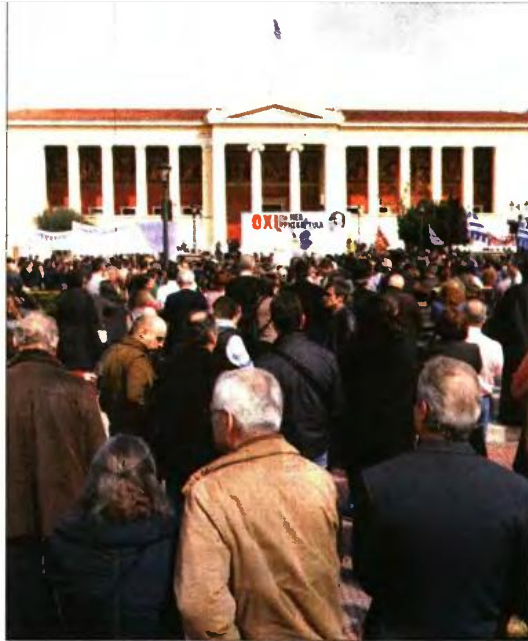
Από τη χθεσινή συγκέντρωση στα Προπύλαια

Κεντρικός ομιλητής της συγκέντρωσης ήταν ο καθηγητής της Θεολογικής Σχολής του Αρι-