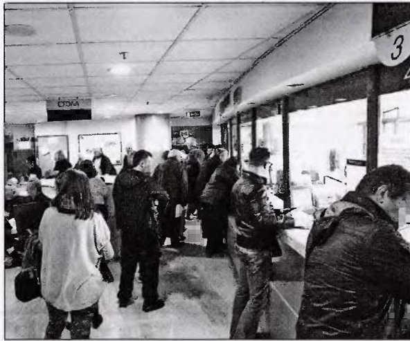
Τα επιδόματα φέτος σε σχέση με το 2017 είναι μειωμένα ή καταργούνται ολοσχερώς για το 10% των οικογενειών. Ωστόσο η πλειοψηφία των οικογενειών που έχουν έως 2 παιδιά θα δουν αυξήσεις

τρίτο και κάθε εξαρτώμενο τέκνο πέραν του τρίτου. Για την Β κατηγορία: • 42 ευρώ ανά μήνα για το πρώτο εξαρτώμενο τέκνο • επιπλέον 42 ευρώ ανά μήνα για το δεύτερο εξαρτώμενο τέκνο • επιπλέον 84 ευρώ ανά μήνα για το τρίτο και κάθε εξαρτώμενο τέκνο πέραν του τρίτου. Για την Γ κατηγορία: • 28 ευρώ ανά μήνα για το πρώτο εξαρτώμενο τέκνο • επιπλέον 28 ευρώ ανά μήνα για το δεύτερο εξαρτώμενο τέκνο • επιπλέον 56 ευρώ ανά μήνα για το τρίτο και κάθε εξαρτώμενο τέκνο πέραν του τρίτου.