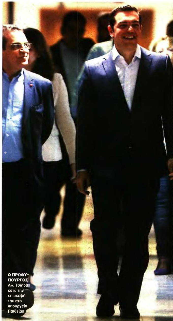
Ο ΠΡΩΘΥΠΟΥΡΓΟΣ ΑΛ. ΤΣΙΠΡΑΣ κατά την επίσκεψή του στο υπουργείο Παιδείας

Ο πρωθυπουργός έκανε ειδική αναφορά και σε δύο σημαντικές πρωτοβουλίες που αφορούν στην κοινωνική πολιτική. Η μία έχει να κάνει με την ενίσχυση των Ολοήμερων Δημοτικών Σχολείων μέσα από τα προγράμματα σίτισης από τα «Σχολικά γεύματα» για μαθητές του δημοτικού. Σκοπός είναι στην επόμενη τριετία γύρω στους 300.000 μαθητές δημοτικού να έχουν δωρεάν σχολικά γεύματα στα ολοήμερα σχολεία, ώστε να έχουν τη δυνατότητα να τρώνε στο σχολείο και κυρίως να τρώνε ποιοτικό φαγητό στο σχολείο.