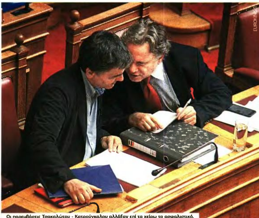
Οι παρεμβάσεις Τσακαλώτου - Κατρούγκαλου αλλάξαν επί τη χείρω το ασφαλιστικό.

3 Κατεβαίνει το όριο περικοπής σύνταξης από συνταξιούχους που εργάζονται. Στο εξής όσοι παίρνουν πάνω από 780 ευρώ θα έχουν