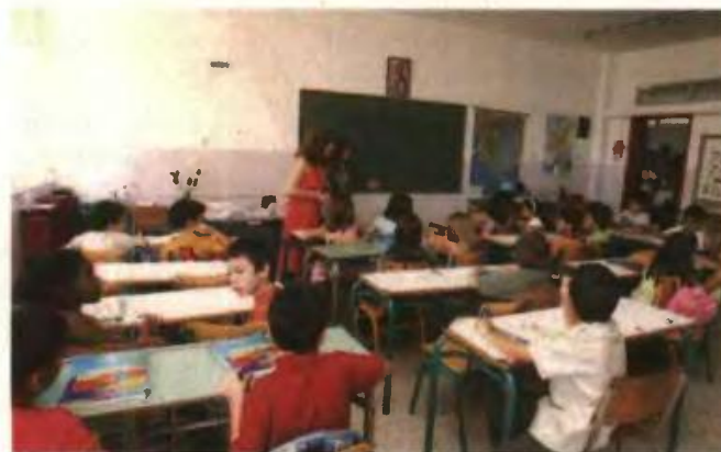
Σημαντικές βελτιώσεις από το υπουργείο Παιδείας

ενταγμένους σε πρόγραμμα απεξάρτησης και φυλακισμένους).