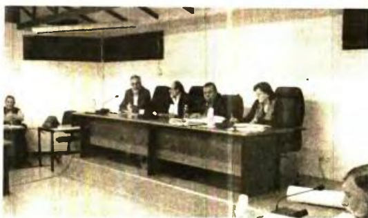
● Η νέα απόφαση που αναμένεται να ληφθεί στην αυριανή συνεδρίαση του Δημοτικού Συμβουλίου προβλέπει μειώσεις στα τιμολόγια

Κλιμάκια - παγίο τέλος, τιμολόγιο 10,00 ευρώ, 0-00 0,00, 1-50 0,29, 51-100 0,45, 101-150 0,6, 151-200 1,2, 201-400 1,80, 401-9999 3,60.