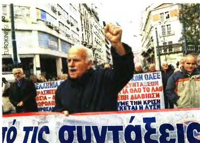
Νέο σοκ για 300.000 συνταξιούχους.

Κλιμακωτές μειώσεις 28-50%. Πληρωμές τέλος Ιουνίου με αναδρομικές περικοπές για τρεις μήνες