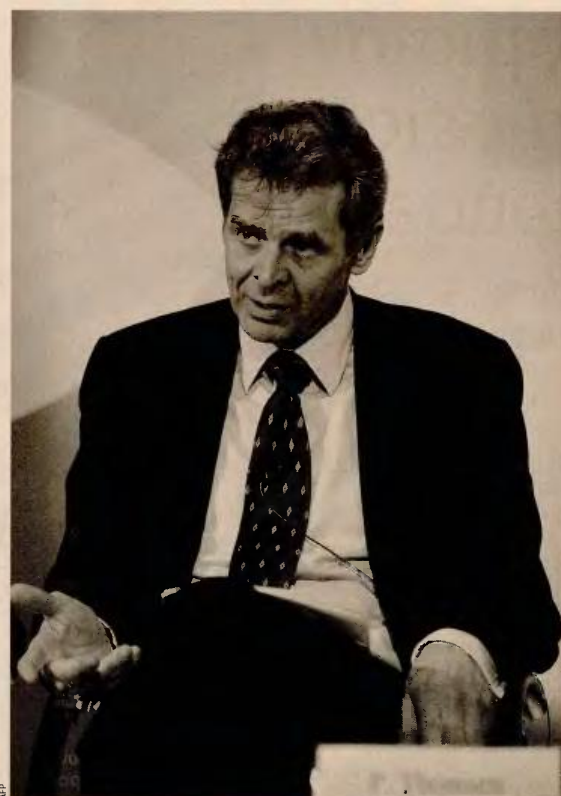
Ο κ. Π. Τόμσεν με άρθρο του επιχειρεί να βάλει «φρένο» στις προσπάθειες τόσο κυβερνητικών κύκλων, όσο και της Ευρωζώνης, να στοχοποιήσουν τον ίδιο και το Ταμείο ως τους «κακούς» της διαπραγμάτευσης, που ζητούν πολλά και σκληρά μέτρα.

Στο πλαίσιο αυτό θέτει και θέμα αλλαγής των δημοσιονομικών στόχων, αλλά παραπέμπει στην Ευρωζώνη και στην ελάφρυνση του χρέους. Στο ερώτημα κατά πόσον ένας μικρότερος στόχος θα μπορούσε να κάνει την απαραίτητη ασφαλιστική μεταρρύθμιση λιγότερο απαιτητική, ο ίδιος απαντά ότι αυτό αποτελεί ένα «επίμαχο θέμα ανάμεσα στους Ευρωπαίους εταίρους της Ελλάδας, κατά ένα μέρος γιατί αρκετοί εταίροι είναι αναγκασμένοι να έχουν