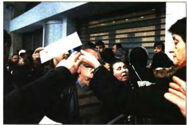
Ουρές πολιτών που υπέβαλαν αίτηση για το Κοινωνικό εισόδημα

Εάν ο δικαιούχος δηλώσει ότι το τελευταίο εξάμηνο είχε έσοδα, για παράδειγμα, 900 ευρώ, δηλαδή εισέπραξε με αναγωγή 150 ευρώ τον μήνα, τότε θα λάβει ενίσχυση που αντιστοιχεί στο ποσό των 50 ευρώ τον μήνα, ώστε συνολικά το μηνιαίο εισόδημά του να φτάσει τα 200 ευρώ. Υπάρχουν περιπτώσεις αιτήσεων που έχουν κατατεθεί και έχουν εγκριθεί, για τις οποίες προβλέπεται ότι η οικονομική ενίσχυση που θα προσφέρει το πρόγραμμα κυμαίνεται στα επίπεδα των 13 ευρώ σε μηνιαία βάση!