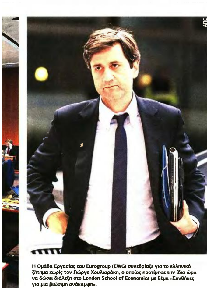
Η Ομάδα Εργασίας του Eurogroup (EWG) συνεδριάζει για το ελληνικό ζήτημα χωρίς τον Πύργο Χουλιαράκη, ο οποίος προτίμησε την ίδια ώρα να δώσει διάλεξη στο London School of Economics με θέμα «Συνθήκες για μια βιώσιμη ανάκαμψη».