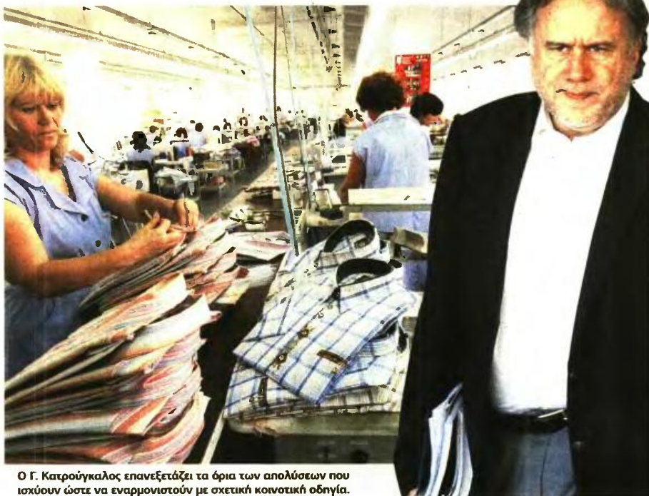
Ο Γ. Κατρούγκαλος επανεξετάζει τα όρια των απολύσεων που ισχύουν ώστε να εναρμονιστούν με σχετική κοινοτική οδηγία.

Το μισό «ναι» που είπε χθες ο κ. Κατρούγκαλος αφορούσε στην έγκριση για τις ομαδικές απολύσεις, με εγγυήσεις για τους εργαζόμενους: «Μπορεί να είναι άλλη η δημοσία αρχή και όχι ο υπουργός που θα γνωμοδοτεί για τις ομαδικές απολύσεις», ανέφερε χθες το πρωί (μιλώντας στην ΕΡΤ), προσθέτοντας ότι το ζητούμενο είναι να υπάρχουν εγγυήσεις και προστασία για τους εργαζόμενους. Σήμερα η δικαιοδοσία για τις ομαδικές απολύσεις παραμένει στο υπουργείο Εργασίας. Οι δανειστές πιέζουν για πλήρη κατάργηση των διοικητικών εμποδίων, ώστε να ισχύσει στην Ελλάδα ό,τι ισχύει σε όλες τις άλλες ευρωπαϊκές χώρες όπου δεν απαιτείται