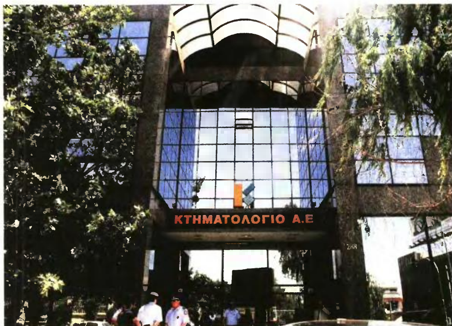
Νέο κτίσημα από το Κτηματολόγιο για τους ιδιοκτήτες ακινήτων.

Σύμφωνα με την Εταιρία Κτηματολογίου και Χαρτογραφήσεων (ΕΚΧΑ) Α.Ε., μέχρι το τέλος του χρόνου θα ανακοινωθούν ηλεκτρονικά, στους εν λόγω ιδιοκτήτες, τα «ραβασάκια» για την πληρωμή των τελών κτηματογράφησης 35 και 20 ευρώ ανά ιδιοκτησία που δήλωσαν στο πρώτο πρόγραμμα. Οι ιδιοκτήτες θα μπορούν να παραλάβουν τα ειδοποιητήρια από την ιστοσελίδα της ΕΚΧΑ, με τους κωδικούς του TAXIS που διαθέτουν για τον προσωπικό τους λογαριασμό στην εφορία, για να πληρώσουν το τέλος κτηματογράφησης στις τράπεζες που συνεργάζονται με την ΕΚΧΑ.