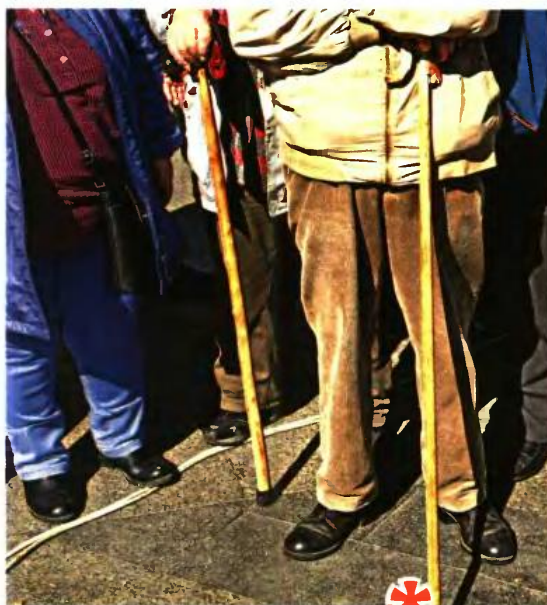
ΕΥΡΩΚΙΝΗΣΗ / ΜΙΝΙΜΑΛ ΣΤΕΙΝΙΟΞ

Πέραν λοιπόν της εθνικής σύνταξης, η οποία κυμαίνεται από 241,92 ευρώ έως 384 ευρώ (ανάλογα την ηλικία και τα έτη