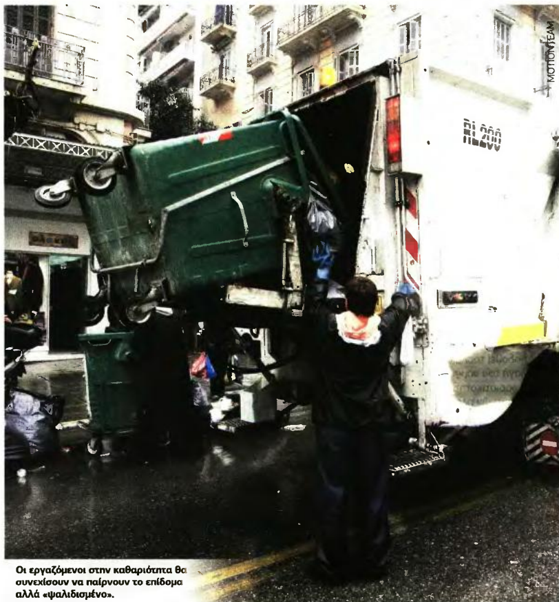
Οι εργαζόμενοι στην καθαριότητα θα συνεχίσουν να παίρνουν το επίδομα αλλά «ψαλιδισμένο».

Είναι πιθανό να θεσπιστεί ένα ποσό (αντί τριών σήμερα) και να καταβάλλεται ενσωματωμένο στο μισθό των υπαλλήλων που θα κριθεί ότι εκτίθενται σε κινδύνους υγείας ή