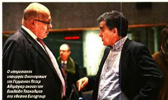
Ο υπηρεσιακός υπουργός Οικονομικών της Γερμανίας Πιτερ Άλτμπίγκερ ακουσι τον Ευκλήλιο Τσακαλιώτο στο χθεσινό Eurogroup

Εκτός από το αφορολόγητο, τις συντάξεις και τα αντίμετρα η κυβέρνηση έχει