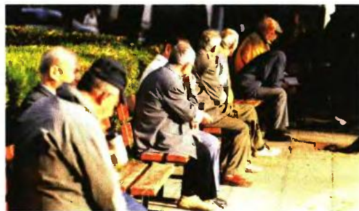
Ακόμη και κατά 2,5 εκατομμύρια αναμένεται να μειωθεί ο πληθυσμός της χώρας έως το 2050

Σύμφωνα με τη μελέτη, οι αναμενόμενες μεταβολές των πληθυσμιακών δομών, ιδιαίτερα μέχρι το 2035, καθορίζονται σε μεγάλο βαθμό από το μέγεθος και τη δομή του πληθυσμού σήμερα. «Ειδικότερα, οι γυναίκες που θα διανύσουν τις επόμενες δύο δεκαετίες ευρισκόμε-