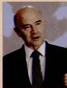
Στις επόμενες 100 μέρες «πρέπει να διατηρηθεί το μομέντουμ και να επιταχυνθούν οι διαδικασίες», δήλωσε ο Π. Μοσκοβισί.

Στις 100 επόμενες μέρες «πρέπει να διατηρηθεί το μομέντουμ και να επιταχυνθούν οι διαδικασίες», όπως είπε χαρακτηριστικά ο αρ-