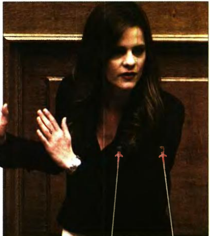
Η υπουργός Εργασίας Εφη Αχτσιόγλου

Στην παρούσα φάση, εκτός επίσημου διαλόγου μένει η αύξηση του κατώτατου μισθού των 581 ευρώ, με δεδομένο ότι οι θεσμοί δεν φαίνεται να συζητούν την αλλαγή του