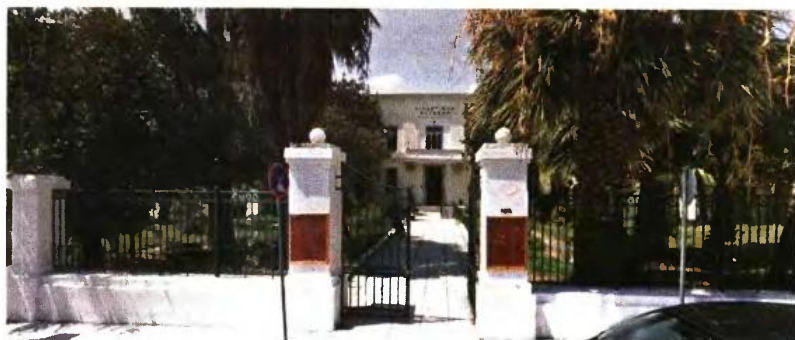
Στο Μονομελές Πλημμελειοδικείο Βόλου δικάζεται σήμερα απάτη με πολυτεκνικά επιδόματα

Το ζευγάρι κατάφερε και πληρωνόταν επιδόματα για πολύτεκνους για πέντε συνεχή έτη από το 2010 έως και το 2014, ζημιώνοντας με αυτόν τον τρόπο τον ΟΓΑ.