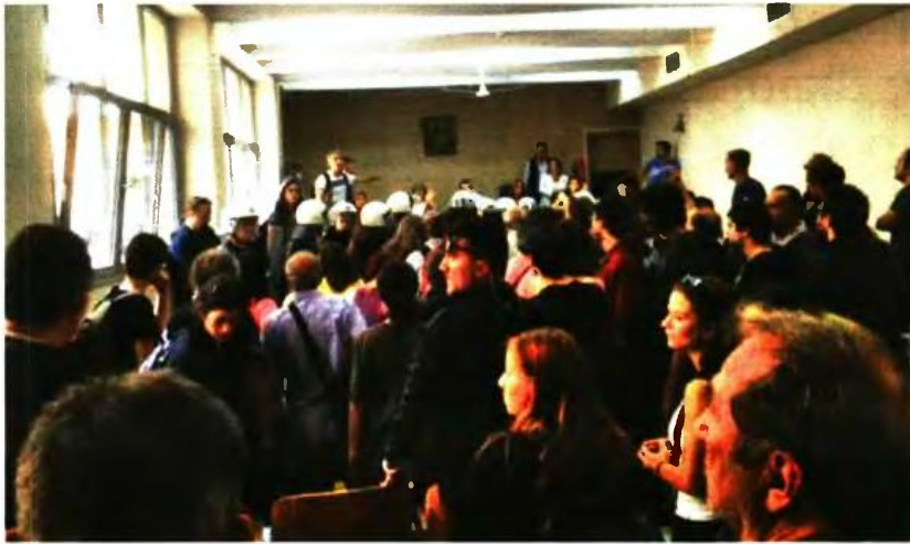
Αλγεινή εντύπωση προκάλεσε η παρουσία δυνάμεων των ΜΑΤ για ακόμη μία φορά μέσα στην αίθουσα του δικαστηρίου όπου διεξάγονται οι πλειστηριασμοί