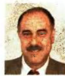
ΓΡΑΦΕΙΟ ΗΡΑΚΛΗΣ ΠΕΡΑΚΗΣ*

ΤΑ ΝΕΑ πολυθρησκευτικά Προγράμματα Σπουδών πρέπει να αποσυρθούν άμεσα, διότι όπως τόνισε ο Αρχιεπίσκοπος κ. Ιερώνυμος «είναι απαρρόδετα, επικίνδυνα και δεν θα αποδώσουν καρπούς, αλλά μεγάλη ζημιά στην Παιδεία και στην κοινωνία μας». Βασισμένοι στις θέσεις αυτές και στα δικά τους συμπεράσματα από τη μελέτη των