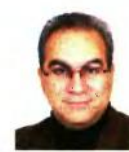
ΓΡΑΦΕΙΟ ΔΗΜΗΤΡΗΣ ΜΟΣΧΟΣ*

ΤΑ ΝΕΑ Προγράμματα Σπουδών των Θρησκευτικών επιδιώκουν την ευαισθητοποίηση και τη σταδιακή κριτική εμβάθυνση των μαθητών στη δική τους θρησκευτική παράδοση ενώ ταυτόχρονα διδάσκουν (με σύγχρονο τρόπο, δηλ. με την κατασκευή και ανακάλυψη της γνώσης από τους ίδιους τους μα-