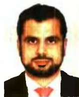
Γράφει ο Διονύσιος Ρίζος

Σε αναμονή του επόμενου κύματος περικοπών στις επικουρικές συντάξεις βρίσκονται περίπου 30.000 συνταξιούχοι από διάφορα Ταμεία, για τους οποίους έφτασε η σειρά του επανυπολογισμού των παροχών τους και της περικοπής της επικουρικής σύνταξης. Εισι στις 4 Οκτωβρίου, όταν και θα κατατεθούν οι επικουρικές από το ΕΤΕΑ, μειωμένες συντάξεις θα δουν οι δικηγόροι, οι πρώην πρατηριούχοι, οι αστυνομικοί, ορισμένοι τραπεζοϋπάλληλοι και άλλοι. Για όλες αυτές τις κατηγορίες οι μειώσεις αφορούν εκείνους τους δικαιούχους επικουρικής σύνταξης που το άθροισμα των συντάξεων