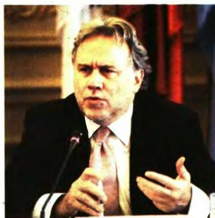
Ο υπουργός Εργασίας Γιώργος Κατρούγκαλος παρέλαβε χθες το υπόμνημα της επιτροπής εμπειρογνομόνων.

4 Περισσότερη ευελιξία για την αποφυγή απολύσεων Η περαιτέρω διύρυνση των μορφών ελαστικής εργασίας, σύμφωνα με το πόρισμα, μπορεί να