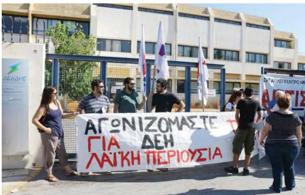
Οι αγρότες θα συγκεντρωθούν αύριο στις 11 το πρωί στα γραφεία της ΔΕΗ.

Χωρίς ρεύμα άφησε η ΔΕΗ το τελευταίο διάστημα στο νομό Ηρακλείου δεκάδες αγροτικά νοικοκυριά, όπως καταγγέλλουν οι Αγροτικοί Σύλλογοι Αστερουσίων, Ηρακλείου και Αρχανών, η προσωρινή Διοικούσα Επιτροπή του Αγροτικού Συλλόγου Καζαντζάκη και η Επιτροπή Αγώνα Αγροτών του Αρκαλοχωρίου, που διοργανώνουν για αύριο το πρωί κινητοποίηση στο Τσαλικάκι.