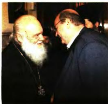
Ο ΑΡΧΙΕΠΙΣΚΟΠΟΣ ΙΕΡΩΝΥΜΟΣ με τον υπουργό Παιδείας Νίκο Φίλη

Μ ια εξαιρετικά σκληρή, ως προς το περιεχόμενό της, επιστολή έστειλε χθες το πρωί στον πρωθυπουργό Αλέξη Τσίπρα ο Αρχιεπίσκοπος Ιερώνυμος, εξηγώντας την αντίθεση της Εκκλησίας στις αλλαγές που προωθήθηκαν στο μάθημα των Θρησκευτικών.