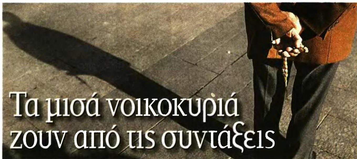
ΑΠΕΜΠΕ / ΙΩΑΝΝΗΣ ΚΟΝΤΕΛΙΑΣ