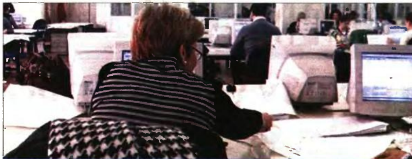
Οι βασικοί μισθοί των δημοσίων υπαλλήλων (από 1/1/2016)

β) Εστω υπάλληλος Πανεπιστημιακής Εκπαίδευσης ο οποίος κατά την 31/12/2017 κατέχει το Μ.Κ. 3, δεν έχει προσωπική διαφορά και από τη σύγκριση αποδοχών που έγινε στις 31/12/2015 έλαβε αύξηση ύψους 60 ευρώ στον βασικό μισθό του, την οποία λαμβάνει σε τέσσερις ισόποσες δόσεις. Επίσης, κατά την κατάταξη του την 1/1/2016 είχε πλεονάζοντα χρόνο έξι μήνες, ενώ με αίτησή του μετά την 1/1/2016 ζήτησε την αναγνώριση μεταπτυχιακού τίτλου σπουδών και επομένως από 1/1/2018 δικαιούται προώθηση κατά δύο μισθολογικά κλιμάκια. Ο υπάλληλος αυτός μετά την 1/1/2018 που ενεργοποιείται η μισθολογική εξέλιξη προωθείται κατά 2 Μ.Κ., κατατάσσεται στο 5ο Μ.Κ. και λαμβάνει στο ακέραιο τη διαφορά μεταξύ των δύο κλιμακίων (118 ευρώ), καθώς και την τριπλή δόση της αύξησης που είχε προκύψει κατά την αρχική κατάταξη με τον ν. 4354/2015. Για την αλλαγή του επόμενου Μ.Κ. θα πρέπει να περάσουν 18 μήνες (συν έξι μήνες πλεονάζοντα χρόνος), ώστε να συμπληρωθεί το διάστημα των 24 μηνών που απαιτείται για μισθολογική εξέλιξη. Στην περίπτωση που ο υπάλληλος αυτός έχει και προσωπική διαφορά, αυτή συμψηφίζεται με την αύξηση που προέκυψε από την αλλαγή του κλιμακίου (από τη μισθολογική ωρίμανση).