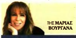
THE MARIAS BOYFANA

Ακόμη και για τις περιοχές όπου θα μειωθεί η τιμή ζώνης, η φορολογητέα αξία των καταστημάτων θα παραμείνει ακριβή λόγω εφαρμογής των υψηλών συντελεστών εμπορικότητας