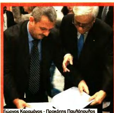
Γιώργος Καραμάνος - Προκόπης Παυλόπουλος

Πριν από λίγες ημέρες επίσης πραγματοποιήθηκε ακόμη μία έκθεση βασισμένη στη περίοδο της γερμανικής Κατοχής. Η έκθεση φωτογραφίας με τίτλο «Δεν Λησμονώ... μία εικόνα χίλες λέξεις» έγινε με αφορμή τη Διεθνή Ημέρα Μνήμης για τα θύματα του Ολοκαυτώματος και διοργανώθηκε στο Ζάππειο Μέγαρο. Στο πλαίσιο της έκθεσης, παρουσιάστηκαν στο κοινό περισσότερα από 350 φωτογραφικά ντοκουμέντα της εποχής καθώς και πάνω από 100 φωτογραφικά ντοκουμέντα από διάφορες χώρες της Ευρώπης. Μέσα από τις εικόνες ο θεατής είχε την ευκαιρία να έρθει αντιμέτωπος με μία πραγματική απεικόνιση των δεινών που υπέστη τόσο ο ελληνικός λαός, όσο και οι υπόλοιποι λαοί της Ευρώπης. Την τελετή έναρξης τίμησε με την παρουσία του ο Πρόεδρος της Δημοκρατίας Προκόπης Παυλόπουλος, ο οποίος ξεναγήθηκε στον χώρο της έκθεσης.