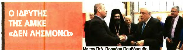
Με τον ΠτΔ, Προκόπη Παυλόπουλο

Μέσα από τη δωρεά του Γ. Καραμάνου, κάθε χρόνο βοηθούνται πάνω από 2.000 οικογένειες