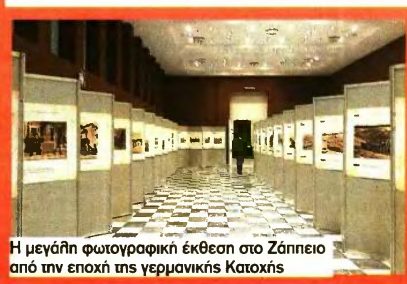
Η μεγάλη φωτογραφική έκθεση στο Ζάππειο από την εποχή της γερμανικής Κατοχής

Γενικά όχι. Όλα αυτά τα χρόνια, ό,τι κάνω το κάνω μαζί με κάποιους επιχειρηματίες. Όπως προείπα, είναι τραγικό να περπατάμε στον δρόμο και να βλέπουμε ανθρώπους να ψάχνουν στα σκουπίδια να φάνε. Αλλωστε, το μόνιμο είναι «Η ισχύς εν τη ενώσει». Αυτό χρειάζεται σήμερα η Ελλάδα.