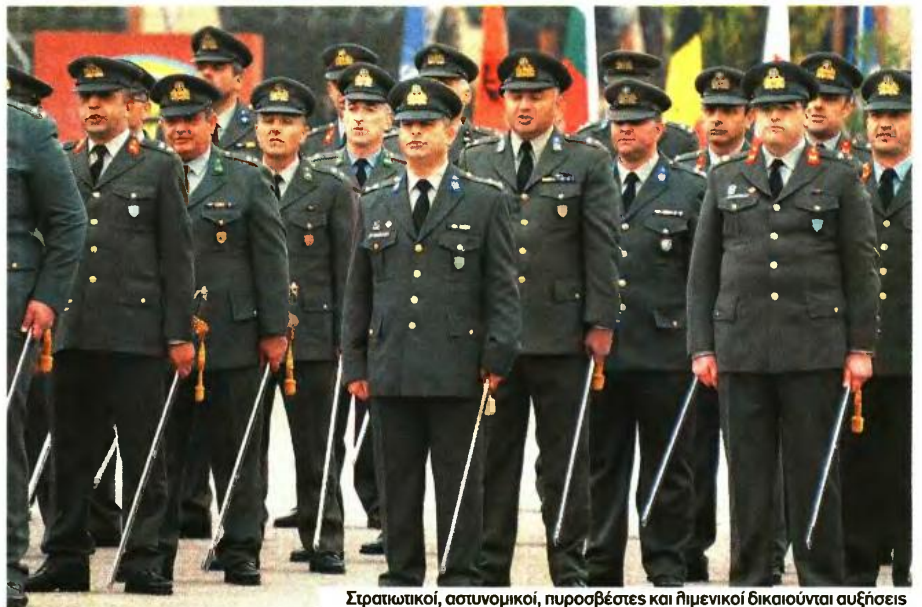
Στρατιωτικοί, αστυνομικοί, πυροσβέστες και λιμενικοί δικαιούνται αυξήσεις 20-232 ευρώ τον μήνα και αναδρομικά 1.300 -15.000 ευρώ

«Την 29η Ιανουαρίου 2018, οι πρόεδροι των τριών Ενώσεων Αποστράτων Αξιοματικών συναντήθηκαν με τον υπουργό Εθνικής Άμυνας κ. Πάνο Καμμένο. Σύμφωνα με την επίσημη ανακοίνωσή τους «στην αρχή ο ΥΕΘΑ έκανε γνωστό το πρόγραμμά του για την αγορά των δανείων των εν ενεργεία και αποστρατεία στελεχών των ΕΔ από Οργανισμό του ΥΕΘΑ, μάλλον από τον ΑΟΟΑ, με σκοπό το "κούρεμα" και τη μείωση του κόστους εξυπηρέτησης, επί του οποίου θα υπάρξουν λεπτομερείς ανακοινώσεις. Οι τρεις πρόεδροι παρουσίασαν στον κ. υπουργό τα ακόλουθα οικονομικά θέματα: Επιστροφή των συντάξεων στο καθεστώς της 31/07/2012 και επιστροφή των υπόλοιπων αναδρομικών. Ο κ. υπουργός απάντησε ότι έχουν γίνει πολλές προσπάθειες στο παρελθόν για την υλοποίηση των αποφάσεων του ΣτΕ, πλην όμως το υπουργείο Οικονομικών και οι "θε-