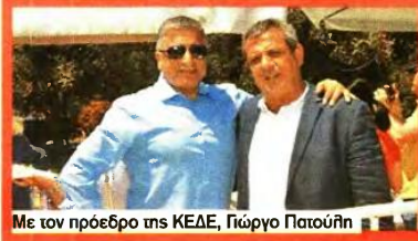
Με τον πρόεδρο της ΚΕΔΕ, Γιώργο Πατούη