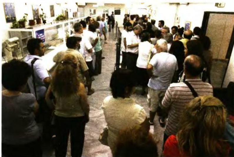
Μέχρι τέλος Φεβρουαρίου πρέπει να πληρωθούν οι εισφορές του 2016. Το Μάρτιο πρέπει να πληρωθεί το εφάπαξ ποσό της διαφοράς για τα ασφαλιστικά και ακολουθούν οι συμπληρωματικές κύριες εισφορές και τα αναδρομικά επικουρικού.

7. Τέλος, εάν ο ελεύθερος επαγγελματίας έχει οφειλές προς την Εφορία και τα ασφαλιστικά ταμεία (έως 50.000 ευρώ για κάθε περίπτωση), θα πρέπει να εξυπηρετεί και αυτή τη ρύθμιση με ελάχιστο ποσό τα 100 ευρώ το μήνα (από 50 ευρώ η ελάχιστη δόση προς Εφορία και ασφαλιστικό ταμείο).