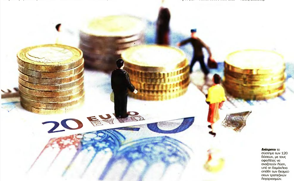
Διάρπνο το σύστημα των 120 δόσεων, με τους οφειλέτες να αναζητούν λύση, υπό τη δαμόκλειο σπάθη των δεσμεύσεων τραπεζικών λογαριασμών.

➤ Από φορολογούμενο που έχει συσσωρεύσει χρέη και αναγκάστηκε υπό το βάρος τους να διακόψει την άσκηση επιχειρηματικής δραστηριότητας οι Αρχές ζητούν να «ξανανοίξει» τα βιβλία, αν θέλει να έχει δικαίωμα υπαγωγής στη ρύθμιση. Δηλαδή, του ζητούν να φορτωθεί και πάλι το τέλος επιτηδεύματος των 650 ευρώ και να αρχίσει να φορτώνεται νέες ασφαλιστικές εισφορές -τις οποίες θα πληρώνει είτε έχει είτε δεν έχει κέρδος από τη δουλειά- μόνο και μόνο για να μπορεί να κάνει αίτηση υπαγωγής στη ρύθμιση. Από τις οδηγίες που δόθηκαν δεν είναι σαφές για πόσο χρονικό διάστημα θα πρέπει να παραμείνει «ανοικτό» η επαγγελματική δραστηριότητα και μετά την αίτηση υπαγωγής στη ρύθμιση. Φαίνεται ότι αρκεί να υπάρχει ενεργή επαγγελματική δραστηριότητα κατά την υποβολή της ηλεκτρονικής αίτησης.