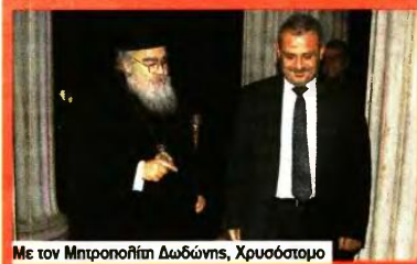
Με τον Μητροπολίτη Δωδώνης, Χρυσόστομο