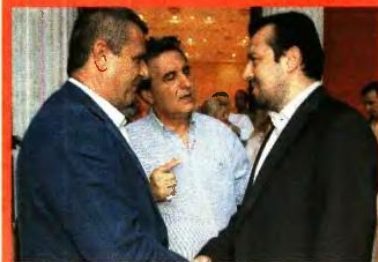
Με τον υπουργό Ψηφιακής Πολιτικής, Νίκο Παππά