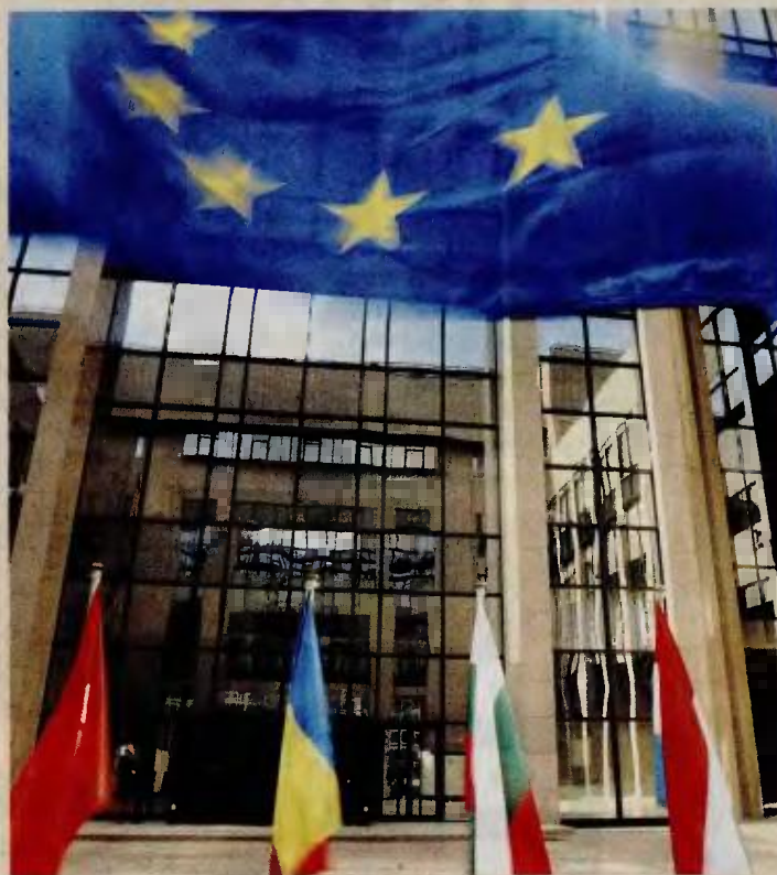
Την εκπλήρωση όλων των προαπαιτούμενων για την εκταμίευση της δόσης ζήτησε το χθεσινό Euroworking Group από την ελληνική κυβέρνηση.

Συγκεκριμένα, στο θέμα των πλειστηριασμών δίνεται η περισσότερη δυνατή σημασία από τους θεσμούς και το Euroworking Group κάλεσε, μεταξύ άλλων, να γίνει η αντικατάσταση των συμβολαιογράφων που δεν φαίνεται να συμμετέχουν στη διαδικασία και να διαπιστωθεί μέχρι την άλλ-