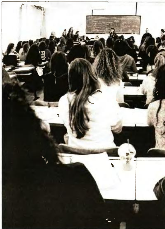
Φωτογραφία αρχείου από αίθουσα του Καποδιστριακού Πανεπιστημίου Αθηνών