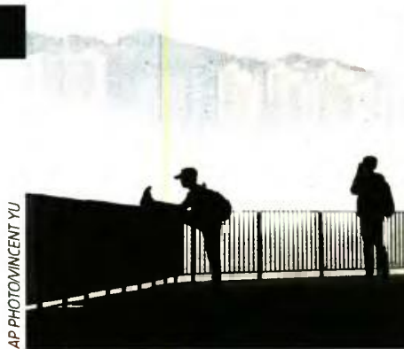
■ Την άνοιξη η πυκνή ομίχλη στο λιμάνι του Λόγγη Κογκά είναι συνηθισμένη

Η « Δημοκρατία » σχολιάζει τα ευρήματα της δημοσκοπήσης της Pulse για το