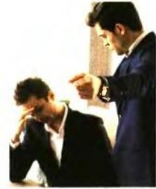
Ο υπάλληλος έχει δημόσιο δικαίωμα είσπραξης του μισού των αποδοχών του.

η απόφαση είναι δεσμευτική, είτε έχει θετικό είτε αρνητικό περιεχόμενο. Σε περίπτωση απαλλαγής του υπαλλήλου από κάθε πειθαρχική ευθύνη και εφόσον υπάρχει τελεσίδικη δικαστική απόφαση, έχει δημόσιο δικαίωμα να ζητήσει την επιστροφή του μέρους των αποδοχών του που παρακρατήθηκε. Αντιθέτως, αν του επιβλήθηκε η πειθαρχική ποινή της οριστικής παύσης λόγω αδικαιολόγητης απουσίας από την εκτέλεση καθηκόντων, ο υπάλληλος δεν δικαιούται τις αποδοχές αργίας του.