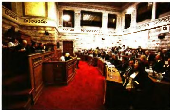
Από την προχτεσινή πρώτη συνεδρίαση της αρμόδιας Κοινοβουλευτικής Επιτροπής για το Ασφαλιστικό

Σημείωσε ότι η κυβέρνηση επιδιώκει να εξασφαλίσει στο κεφάλαιο φτηνό εργατικό δυναμικό και «γι' αυτό ο ΣΕΒ, ο ΣΕΤΕ, οι άλλες οργανώσεις του μεγάλου κεφαλαίου χειροκρότησαν, στήριξαν και στηρίζουν, γιατί ήταν διαρκής διακαής ο πόθος τους να καταργηθεί ο κοινωνικός χαρακτήρας