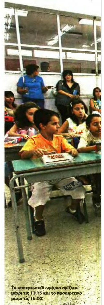
Το υποχρεωτικό ωράριο ορίζεται μέχρι τις 13.15 και το προαιρετικό μέχρι τις 16.00.

Στο μεταξύ, «πολύ κακό για το τίποτα» αποδείχτηκε η διάταξη για την πρόσληψη αναπηρωτών, μιας και τελικά το υπουργείο Παιδείας έκανε πίσω και την σπέσιν. Υπευθυμίζουμε ότι οι αντιδράσεις των εκπαιδευτικών ήταν άμεσες, κυρίως λόγω της αδικίας που υφίσταντο, όπως υποστήριξαν, στο ζήτημα της προ우πρειαίας. Παρά τη σκληρή στάση που είχε κρατήσει ο υπουργός Παιδείας σε συνάντηση μαζί τους, τονίζοντας ότι το νέο σύστημα διορισμού θα κατατεθεί και θα ψηφιστεί «γιατί τους έχει δεσει τα χέρια απόφαση του Σ.Τ.Ε.», τελικά ο δικαστικός πέλκευς δεν ήταν τόσο απειλητικός, μιας και ο κ. Φίλης χθες ανακοίνωσε ότι οι προσλήψεις θα γίνουν με το παλιό σύστημα. ■