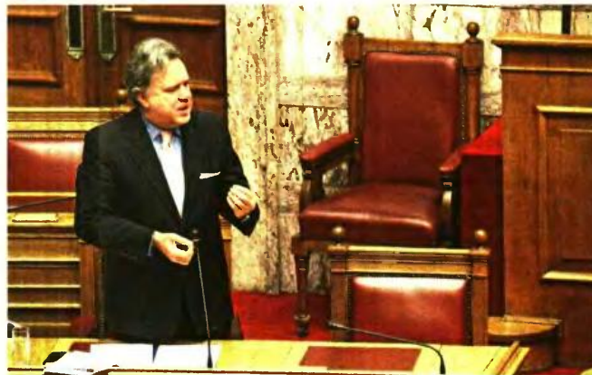
ΕΥΡΟΚΙΝΗΣΗ / ΠΑΝΑΓΙΩΤΗΣ ΣΤΟΛΙΉ

Είναι χαρακτηριστικό ότι στην επτάωρη συνεδρίαση της Δευτέρας μόλις τέσσερις βουλευτές του ΣΥΡΙΖΑ από τους περίπου 50 που συμμετέχουν στις δύο Επιτροπές Οικονομικών και Κοινωνικών Υποθέσεων έλαβαν τον λόγο και υπερασπίστηκαν το ασφαλιστικό.