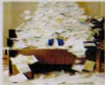
Μόνο στον Ο.Σ.Υ (Μέσα Μαζικής Μεταφοράς Αθήνας) είχαν κατατεθεί από υποψήφιους υπαλλήλους για διορισμό και είχαν γίνει αποδεκτά 135 πλαστοί-παράτυποι τίτλοι σπουδών

694.515 πιστοποιητικά δεκάδων χιλιάδων δημοσίων υπαλλήλων, ενώ σε εξέλιξη βρίσκεται ανάλογος έλεγχος σε άλλους 942 υπαλλήλους με ύποπτα 1995 πιστοποιητικά.