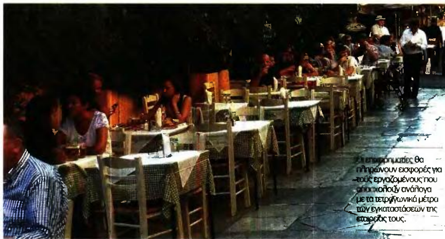
Οι επιχειρηματίες θα πληρώνουν εισφορές για τους εργαζομένους που απασχολούν ανάλογα με τα τετραγωνικά μέτρα των εγκαταστάσεών της εταιρείας τους.

ΑΠΟ ΤΟΝ ΔΗΜΗΤΡΗ ΚΑΤΣΑΓΑΝΗ katsaganis@kefalaiο.gr