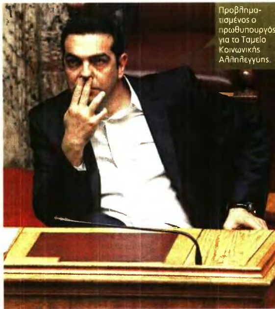
Προβληματισμένος ο πρωθυπουργός για το Ταμείο Κοινωνικής Αλληλεγγύης.

Υπενθυμίζεται ότι από τις συγκεκριμένες εκθέσεις «φωτογραφίζονται» περίπου 300 προνοιακά επιδόματα που πρέπει να επανεξεταστούν. Όλα αυτά την ώρα που, έτσι και αλλιώς, έως τα μέσα Ιουλίου το Κοινωνικό Εισόδημα Αλληλεγγύης αναμένεται να εφαρμοστεί σε 30 δήμους από τις 13 περιφέρειες όλης της χώρας, με βάση τους επίσης