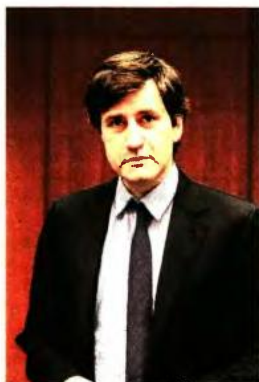
Την Κοινή Υπουργική Απόφαση υπέγραψαν οι Έφφ Αχτσιόγλου και Γ. Χουλιαράκης

του Ενιαίου Συστήματος Ελέγχου και Πληρωμών Συντάξεων Ήλιος, που δημοσιοποίησε το υπουργείο Εργασίας, οι συντάξεις τους δύο πρώτους μήνες του 2017 διατηρήθηκαν στα επίπεδα του 2016. Συγκεκριμένα, βάσει των στοιχείων: