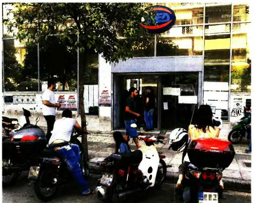
Κόβουν και το «χατζιλίκι» των 75 ευρώ που έδινε ο ΟΑΕΔ για πέντε μήνες σε νεοεισερχόμενους άνεργους ως 29 ετών.

4 Το επίδομα για νεοεισερχόμε-νους άνεργους ως 29 ετών, που ήταν 75 ευρώ το μήνα και κα-ταβαλλόταν για 5 μήνες. Στο εξής, και σύμφωνα με σχετική εσωτερική εγκύκλιο που κοινοποίησε ο ΟΑΕΔ στις υπηρεσίες του, από 19 Μαΐου και μετά δεν θα παραλαμβάνεται καμία αίτηση για την καταβολή του επιδόματος σε νέους ως 29 ετών που εγγράφονται στον ΟΑΕΔ ως νεοεισερχόμενοι άνεργοι, δηλαδή ως άνεργοι με «μηδέν» έσοδα. Όσοι είχαν υποβάλει αίτηση μέχρι τις 18 Μαΐου 2017, πριν από τη δη-μοσίευση του νόμου, θα πάρουν τα