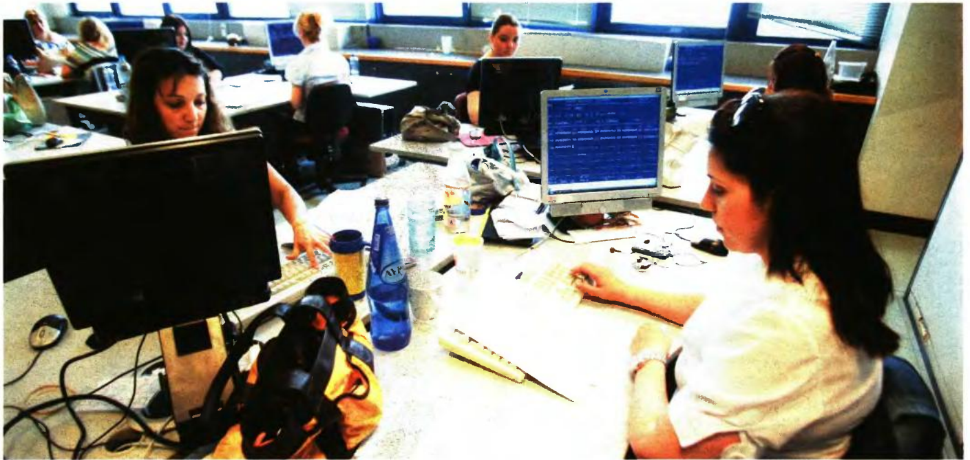
Στόχος του υπουργείου Οικονομικών είναι να εκδοθεί η προκήρυξη μέσα στους προσεχείς μήνες, ώστε το νέο προσωπικό να αναλάβει καθήκοντα στις αρχές του 2018

ΤΑ ΚΡΙΤΗΡΙΑ ΣΥΜΜΕΤΟΧΗΣ ΓΙΑ ΥΠΟΨΗΦΙΟΥΣ ΑΠΟ ΤΡΕΙΣ ΕΚΠΑΙΔΕΥΤΙΚΕΣ ΒΑΘΜΙΔΕΣ