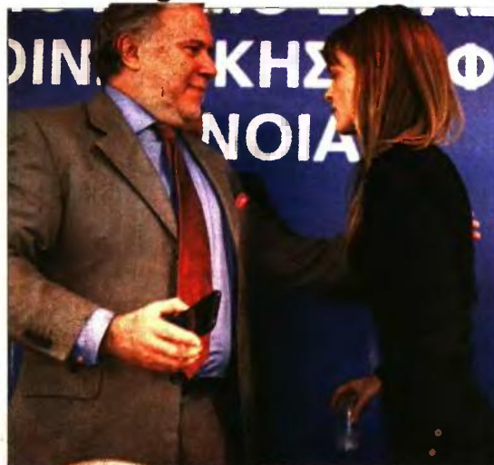
Η υπουργός Εργασίας Εφη Αχτσιόγλου με τον Γιώργο Κατρούγκαλο