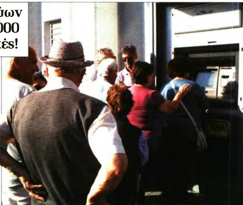
Ουρά συνταξιούχων μπροστά από ΑΤΜ τράπεζας

Ο λόγος είναι η αναδρομική παρακράτηση της εισφοράς 6% υπέρ του ΕΟΠΥΥ. Η εισφορά επιβάλλεται από τον περασμένο μήνα και στις δεύτερες συντάξεις, όμως το μέτρο θα έπρεπε να είχε εφαρμοστεί από τον περασμένο Ιούλιο. Ετσι, από τη σύνταξη Νοεμβρίου αρχίζει η μηνιαία αναδρομική επιβολή της παρακράτησης για το διάστημα Ιουλίου - Οκτωβρίου. Άλλοι 250.000 συνταξιούχοι θα δουν ότι έχει μπει «μαχαίρι» στην