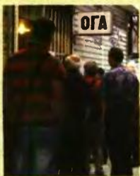
Από 1/1/2017 οι ασφαλισμένοι του ΟΓΑ θα καταβάλλουν εισφορές με βάση το καθαρό φορολογητέο εισόδημά τους

6 Αλλαγές στις εισφορές Από 1-1-2017 αλλάζει ο τρόπος υπολογισμού των εισφορών των αγροτών, καθώς και ο ΟΓΑ εντάσσεται στον ΕΦΚΑ. Έτσι από 1ης Ιανουαρίου οι αγρότες θα κληθούν να καταβάλουν εισφορές με βάση το καθαρό φορολογητέο εισόδημά τους από την αγροτική δραστηριότητα. Συγκεκριμένα για το 2017 η συνολική επιβάρυνση θα είναι 20,95%, με το 14% να αφορά τον κλάδο της κύριας σύνταξης και το 6,95% τον κλάδο υγειονομικής περίθαλψης. Η αύξηση των εισφορών για τους αγρότες ξεκίνησε αναδρομικά από το β' έμμηνο του 2015. Επειδή οι αγρότες πληρώνουν εισφορές ανά έμμηνο, θα νιώσουν στην... τάπη τις αλλαγές του 2017 προς τα τέλη του επόμενου έτους, ενώ ήδη θα έχουν κληθεί να πληρώσουν τις «φουσκωμένες» εισφορές του 2016. Παράδειγμα: Αγρότης ενταγμένος στην 3η ασφαλιστική κλάση πλήρωνε 477 ευρώ το έμμηνο, μέχρι και το α' έμμηνο του 2015. Ο ίδιος πλήρωνε 606,18 για το β' έμμηνο του 2015. Τώρα θα κληθεί να πληρώσει 678,7 για το α' έμμηνο του 2016 (έρχονται τα ειδοποιητήρια τον Νοέμβριο) και άλλα τόσα για το β' έμμηνο του 2016 (συνολικά 1.357 ευρώ για το 2016). Για το 2017, αν δηλώνει 6.500 ευρώ τον χρόνο αγροτικό εισόδημα, θα πληρώσει 1.378 ευρώ.