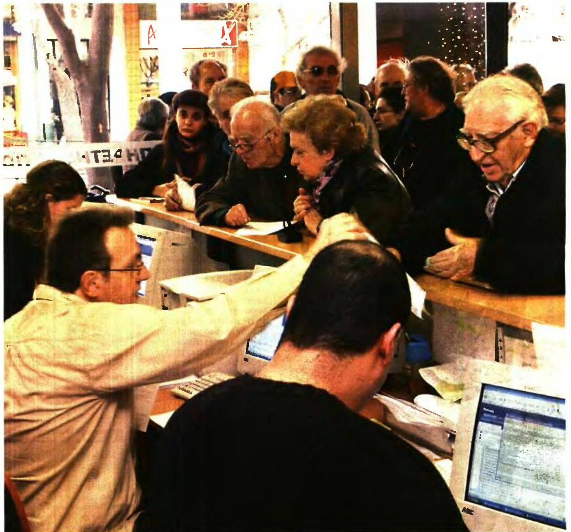
Νέο «κούρεμα» στους 250.000 δικαιούχους του ΕΚΑΣ φέρνει το 2017