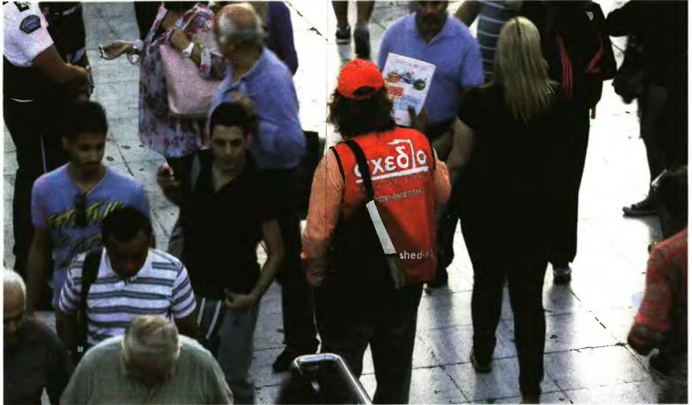
Οι διαπιστευμένοι πωλητές λαμβάνουν το 50% του ποσού πώλησης, δηλαδή 1,5 ευρώ από τα 3 ευρώ που κοστίζει το περιοδικό δρόμου «Σχεδία».