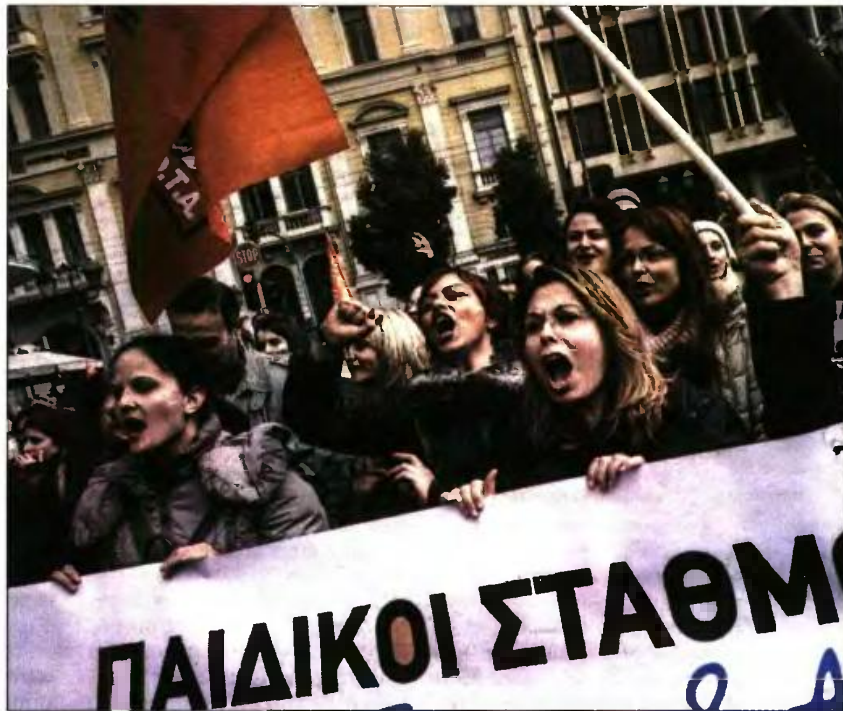
Εργαζόμενοι στους δημοτικούς Παιδικούς σταθμούς πραγματοποιήσαν διαμαρτυρία έξω από το υπουργείο Παιδείας στην Θεσσαλονίκη και καίτοι η ένταξη έξω από τη Βουλή με τον πρόεδρο της ΠΟΕ-ΟΤΑ και τους

Βέβαια, εδώ θα πρέπει να τονιστεί η διαφορά ανάμεσα στον βρεφονηπιακό-παιδικό σταθμό, που είναι δομή φύλαξης και φροντίδας για βρέφη και νήπια έως τεσσάρων ετών και λειτουργεί υπό την επίβλεψη των δήμων, και του νηπιαγωγείου, το