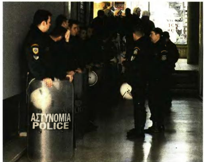
Ενστολή και μη θα είναι η παρουσία των αστυνομικών στα συμβολαιογραφικά γραφεία, σύμφωνα με το σχέδιο της ΕΛ.ΑΣ.

Αντίστοιχη «διπλή» διαταγή για την προστασία των συμβολαιογραφικών γραφείων που μετέχουν στους ηλεκτρονικούς πλειστηριασμούς είχε εκδοθεί από τη Γενική Αστυνομική Διεύθυνση Αττικής στις 18 Ιανουαρίου 2018, αλλά το μεσημέρι της ίδιας μέρας ο Ρουβίκωνας είχε επέλθει σε ένα συμβολαιογραφείο. Η μία διαταγή αφορά την ενεργοποίηση της Άμεσης Δράσης με πρόβλεψη επιπλέον περιπολιών της