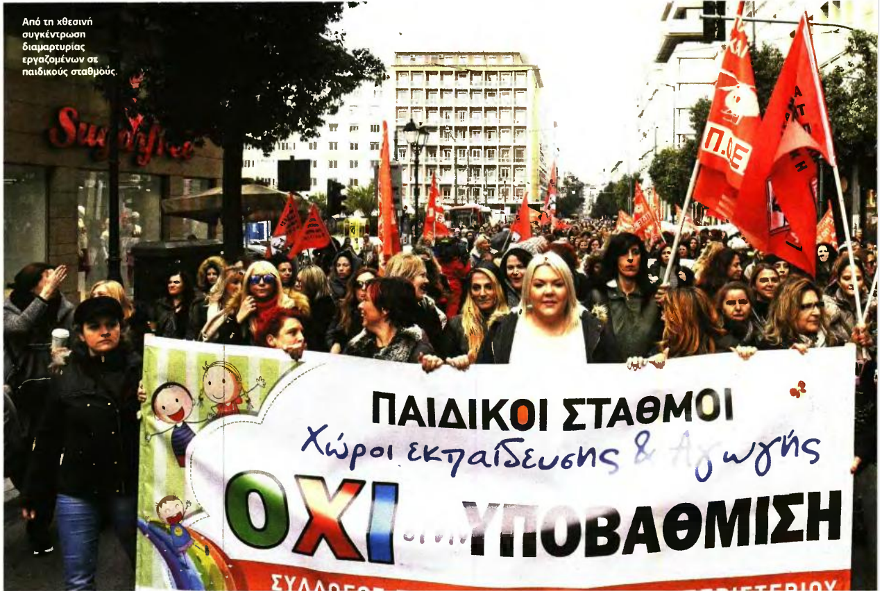
Από τη χθεσινή συγκέντρωση διαμαρτυρίας εργαζομένων σε παιδικούς σταθμούς.

ΥΠΟΧΡΕΩΤΙΚΗ ΠΡΟΣΧΟΛΙΚΗ ΕΚΠΑΙΔΕΥΣΗ: ΣΕ 200 ΔΗΜΟΥΣ ΤΟ ΠΡΟΓΡΑΜΜΑ ΑΠΟ ΤΗΝ ΕΠΟΜΕΝΗ ΧΡΟΝΙΑ • «ΓΚΡΙΖΕΣ ΖΩΝΕΣ»