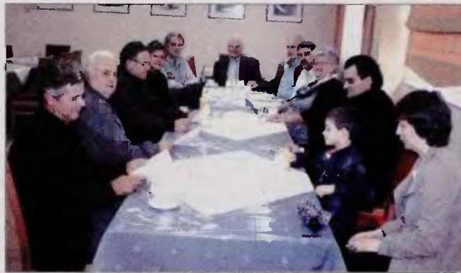
Από τη γενική συνέλευση του συλλόγου χθες στο Επιμελητήριο

"Νιώθουμε αγανακτισμένοι τόνισε ο πρόεδρος για τον φοροεισπρακτικό διωγμό που υφίσταται η