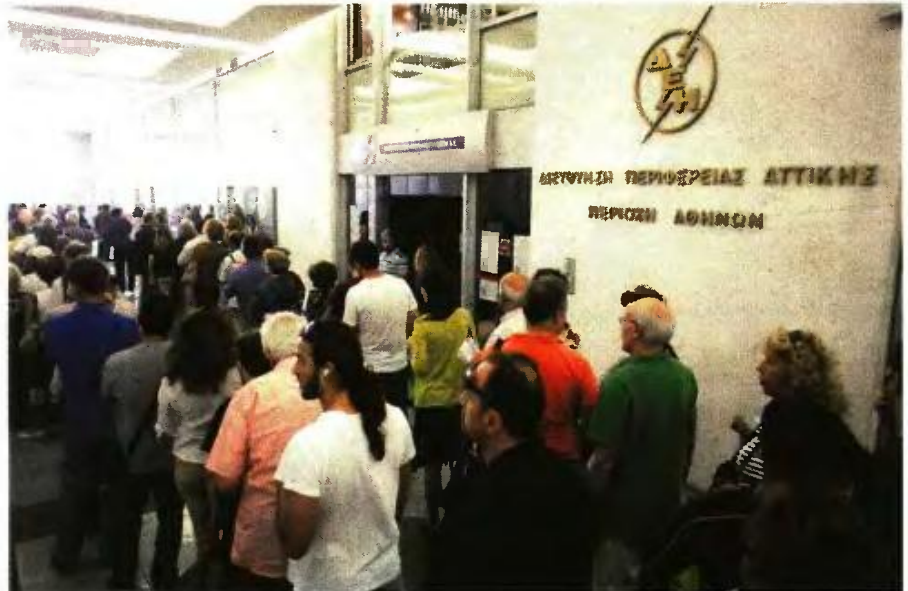
Έντονες ήταν οι διαμαρτυρίες πολιτών που δεν μπορούσαν να ενταχθούν σε καμία από τις δύο νέες κατηγορίες προκειμένου να δικαιούνται μειωμένο τιμολόγιο.

Ηδη εκτός ΚΟΤ αναμένεται να βγουν περισσότεροι από τους σημερινούς 350 χιλ. δικαιούχους και ας προχώρησε το ΥΠΕΝ σε αύξηση των εισοδηματικών κριτηρίων κατά 4.500 ανά κατηγορία μετά τις έντονες διαμαρτυρίες πολιτών που δεν μπορούσαν να ενταχθούν σε καμία από τις δύο νέες κατηγορίες (όσοι πληρούν τα κριτήρια λήψης Κοινωνικού Εισοδήματος Αλληλεγγύης θα λάβουν έκπτωση μέχρι και 70% και όσοι οι πολίτες έχουν κριτήρια αντίστοιχα με αυτά που ορίστηκαν για τη λήψη κοινωνικού μερίσματος θα έχουν έκπτωση μέχρι και 35%). Αναφορικά