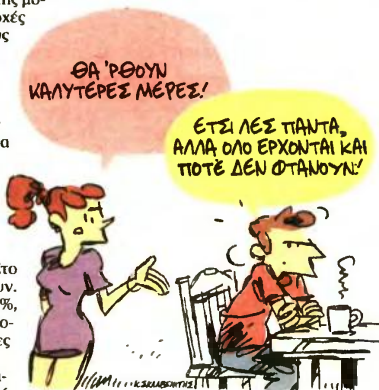
ΤΟΥ ΚΩΣΤΑ ΣΚΛΑΒΕΝΙΤΗ

Το 2009, πριν αρχίσει η κρίση να αφήνει τα σημάδια της στην αγορά εργασίας, μισθό κάτω των 700 ευρώ έπαιρνε μόνο το 13,1% των εργαζομένων στον ιδιωτικό τομέα. Εννέα χρόνια μετά, το 37,4% των ιδιωτικών υπαλλήλων βλέπει πια τις αποδοχές του να έχουν προσγειωθεί κάτω από τα 700 ευρώ. Το ίδιο διάστημα μειώθηκε δραστικά, κατά το ήμισυ περίπου, το ποσοστό των εργαζομένων με καθαρές μηνιαίες αποδοχές μεταξύ 900-1.300 ευρώ,