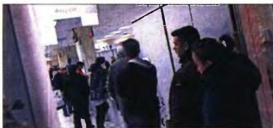
Από τη νέα ρύθμιση θα επωφεληθούν και οι επιδοτούμενοι άνεργοι

κτησαν το 2017 πολύ χαμηλού ύψους εισοδήματα από περιστασιακή απασχόληση θα πρέπει να πληρώσουν το 2018 υπέρογκα ποσά φόρου εισοδήματος, τα οποία θα υπολογιστούν με συνολικό συντελεστή φόρου 44% επί εξωπραγματικών ποσών τεκμαρτού εισο-