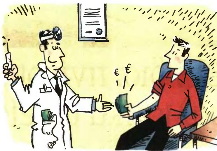
ΕΙΚΟΝΟΓΡΑΦΗ ΚΩΣΤΑΣ ΣΚΛΑΒΕΝΤΙΗΣ

Όμως η ελάφρυνση των ασφαλισμένων είχε διάρκεια περίπου έναν μήνα: η απόφαση του αναπληρωτή υπουργού Υγείας