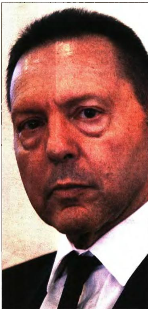
Ο διοικητής της ΤτΕ Γιάννης Στουρνάρας είπε ότι σε 25 χρόνια θα ήθελε ο κόσμος να τον θυμάται ως κάποιον που προσπάθησε να βοηθήσει την ευρωπαϊκή πορεία της χώρας!

Η (αν μη τι άλλο πρωτότυπη) συνέντευξη έχει έντονο «αυτοβιογραφικό» χαρακτήρα και σε πολλά σημεία φτάνει στα όρια της «αγιογραφίας», καθώς ο διοικητής της ΤτΕ καλείται να παρουσιάσει τα μυστικά της επιτυχίας του, ενώ εξομολογείται ότι θα ήθελε να τον θυμάται ο κόσμος ύστερα από 25 χρόνια σαν κάποιον που προσπάθησε να βοηθήσει την ευρωπαϊκή πορεία της χώρας.