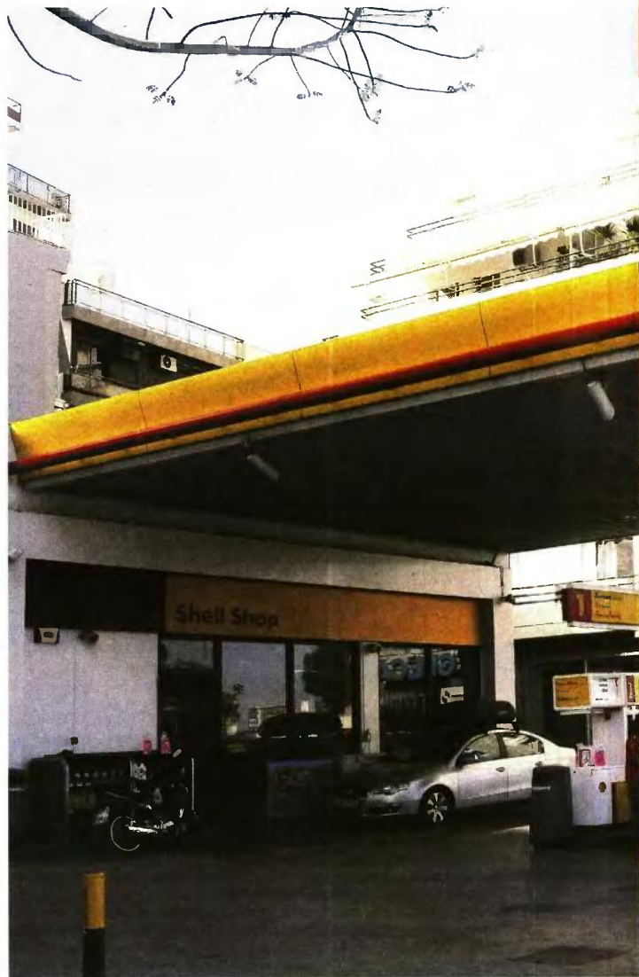
ΤΙΜΕΣ ΑΜΟΛΥΒΔΗΣ (3.1.2017)

Τέλος, σε ό,τι αφορά στο αργό πετρέλαιο, χθες αργά το βράδυ η τιμή του διαμορφωνόταν στα 55,6 δολάρια έναντι 56,82 δολαρίων που ήταν το προηγούμενο κλείσιμο, παρουσιάζοντας μικρή πτώση. ■