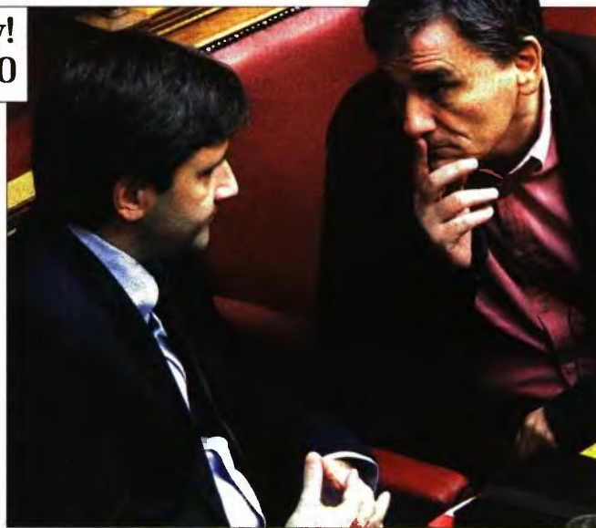
Ο υπ. Οικονομικών Έν. Τσακαλώτος με τον αναπληρωτή του Γ. Χουλιαράκη