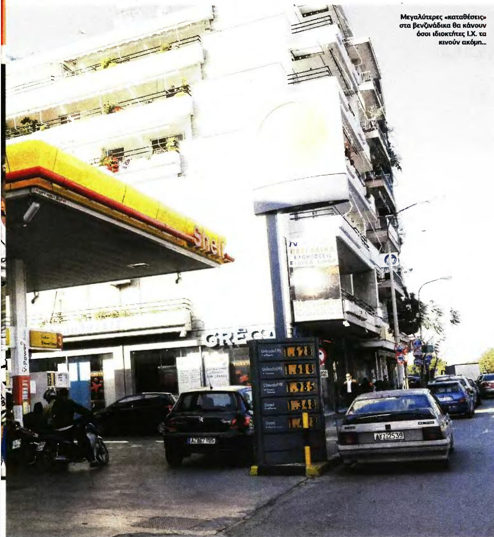
Μεγαλύτερες «καταθέσεις» στα βενζινόδικα θα κάνουν όσοι ιδιοκτήτες Ι.Χ. τα κινούν ακόμη...