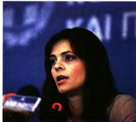
Η υπουργός Εργασίας και Κοινωνικής Ασφάλισης, Έφη Αχτσιόγλου.

Ένα από τα μεγάλα στοιχεία του νέου Ενιαίου Φορέα Κοινωνικής Ασφάλισης αποτελεί η ολοκλήρωση των διαδικασιών για τη λειτουργία της ενοποιημένης ηλεκτρονικής βάσης δεδομένων όλων των ασφαλιστικών ταμείων, η οποία θα αποτελέσει την «καρδιά» όλου του συστήματος. Όπως προανήγγειλε ο αρμόδιος υφυπουργός κοινωνικής ασφάλισης Αναστάσιος Πετρόπουλος, από αυτό τον μήνα όλοι οι υπόχρεοι για την πληρωμή ασφαλιστικών εισφορών (επιχειρήσεις και ιδιώτες) θα αρχίσουν να λαμβάνουν ηλεκτρονικά ειδοποιητήρια για το ύψος των εισφορών που πρέπει να καταβάλλουν μέχρι το τέλος Φε-