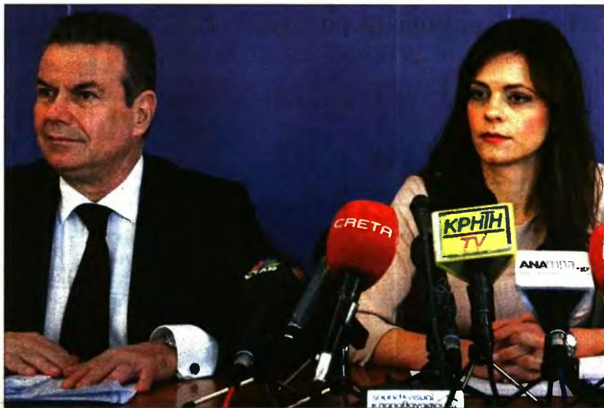
Η υπ. Εργασίας Εφη Αχτσιόγλου με τον υφυπουργό Τ. Πετρόπουλο στη χθεσινή συνέντευξη Τύπου

Η ιστοσελίδα του ΕΦΚΑ θα ενεργοποιηθεί μεν από τις 16 Ιανουαρίου, αλλά θα τεθεί σε πλήρη λειτουργία στις 19 Ιουνίου 2017, ώστε να μπορούν στο εξής οι ασφαλισμένοι και οι συνταξιούχοι να εξυπηρετούνται online χωρίς να απευθύνονται σε κατά τόπους υπηρεσίες του ΕΦΚΑ. Στο site του ΕΦΚΑ θα δημιουργηθεί προσωπικός ασφαλιστικός λογαριασμός για κάθε ασφαλισμένο, ώστε να γνωρίζει σε «πραγματικό χρόνο» τα έτη ασφάλισής του.