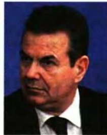
Ο υφ. Κοινωνικής Ασφάλισης, Αναστάσιος Πετρόπουλος.