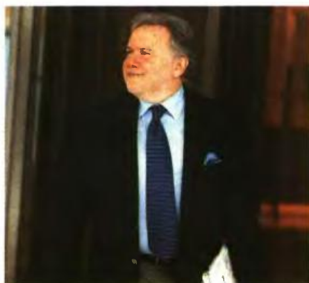
Ο ΥΠΟΥΡΓΟΣ Εργασίας Γ. Κατρούγκαλος

Στο τραπέζι αύριο θα βρεθεί και το εγχείρημα του επανυπολογισμού των καταβαλλόμενων κύριων συντάξεων, όπως και οι εκπτώσεις που έχει προτείνει η κυβέρνηση για τις εισφορές αγροτών και αυτοαπασχολούμενων. Οι δανειστές ζητούν λεπτομέρειες για τον ακριβή μηχανισμό με τον οποίο θα γίνει ο επανυπολογισμός, θέλουν ρητή πρόβλεψη ότι θα εφαρμοστεί ως το 2018 και εστιάζουν στις μεγάλες «προσωπικές διαφορές» που τυχόν προκύψουν (π.χ. πάνω από 300 ευρώ ανάμεσα σε παλαιό και νέο τρόπο υπολογισμού). Οι ενστάσεις δεν λείπουν για τις βελτιωτικές προτάσεις στις εισφορές αγροτών και αυτοαπασχολούμενων με τη λογική πως «ξηλώνουν» το ενιαίο σύστημα. Στο ακανθώδες θέμα των επικουρικών η απόσταση που χωρίζει δανειστές και ελληνική πλευρά είναι πολύ μεγάλη, γι' αυτό το κεφάλαιο αυτό παραπέμπεται για αργότερα... Οι δανειστές εμμένουν σε μεγάλες περικοπές και απορρίπτουν την αύξηση των εισφορών.