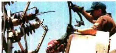
δουχοί και Τεχνικοί για τις Αμφοστάσιες

Την κάλυψη 850 εποχικών θέσεων προγραμματίζει ο ΟΑΣΑ, όπως έχει δηλώσει ο υπουργός Χρήστος Σπυριτζής. Οι θέσεις, όπως είχε, έχουν εγκριθεί από τον τακτικό προϋπολογισμό και θα αφορούν σε οδηγούς, τεχνικούς και ελεγκτές εισιτηρίων. Επίσης, έχει ζητηθεί η κάλυψη 160 ακόμα θέσεων για ειλεγκτές, οι οποίοι θα ενισχυθούν τους ελεγκτικούς των εισιτηρίων σε Πρωτοβάθμια και Τριτοβάθμια Εκπαίδευση. Οι θέσεις προκηρύσσονται για την περίοδο του τουριστικού προγράμματος (συμβάσεις εργασίας ιδιαιτέρως δικαιού χρονίου), σε εξειδικευμένες ειδικότητες των κατηγοριών ΠΕ, ΤΕ και ΔΕ, όπως είναι οι Σταθμάρχες, Κλη-