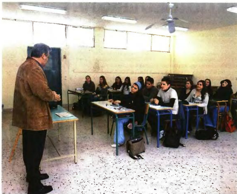
Στη διαδικασία μεταβολής των σχολικών μονάδων συμμετέχουν οι Περιφερειακές Διευθύνσεις Εκπαίδευσης και οι δήμοι

Ο αριθμός των μαθητών, η ορθή διαχείριση του ανθρώπινου δυναμικού, οι όμορες και συσχετιζόμενες μονάδες, η δυνατότητα τα συσχετιζόμενα νηπιαγωγεία να προάγονται σε 4/θέσια έως 6/θέσια, η χιλιομετρική απόσταση που διανύουν οι μεταφερόμενοι μαθητές και οι κτιριακές υποδομές με στόχο τη δημιουργία άρτιων, εξοπλισμένων και επαρκώς στελεχωμένων σχολικών μονάδων. Ιδιαίτερη προσοχή απαιτείται στις περιπτώσεις ιδρύσεων και συγχωνεύσεων, για τις οποίες πρέπει να ορίζεται με σαφήνεια η ακριβής ονομασία και η έδρα λειτουργίας του νέου σχολείου. Επιπλέον, για τις περιπτώσεις ιδρύσεων, προαγωγών και συγχωνεύσεων