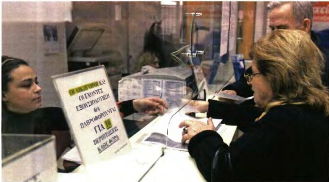
ΣΥΝΤΑΞΗ μέχρι την ενηλικίωση των παιδιών ή μέχρι το τέλος των σπουδών τους θα λαμβάνουν οι μπότερες ανηλικών που είναι χήρες