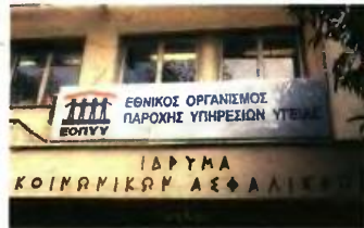
Με τον νόμο 4238/2014, οι υγειονομικοί σχηματισμοί του ΕΟΠΥΥ πέρασαν στο Πρωτοβάθμιο Εθνικό Δίκτυο Υγείας (ΠΕΔΥ), το οποίο διοικείται από το ΕΣΥ.