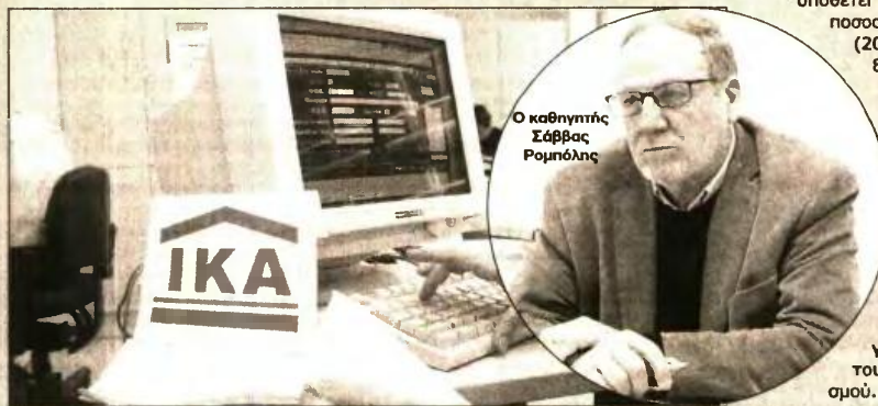
Ο καθηγητής Σάββας Ρομπόλης

Σε διαφορετική περίπτωση η προοπτική μη επίτευξης τόσο υψηλών ποσοστών απασχόλησης στην χώρα μας, κατά τα επόμενα χρόνια, θα σημάνει ακόμη πιο ασφυκτικές πιέσεις στην κοινωνική ασφάλιση, με ό,τι αυτό αρνητικά συνεπάγεται για το βιοτικό επίπεδο του συνταξιοδοτικού πληθυσμού.