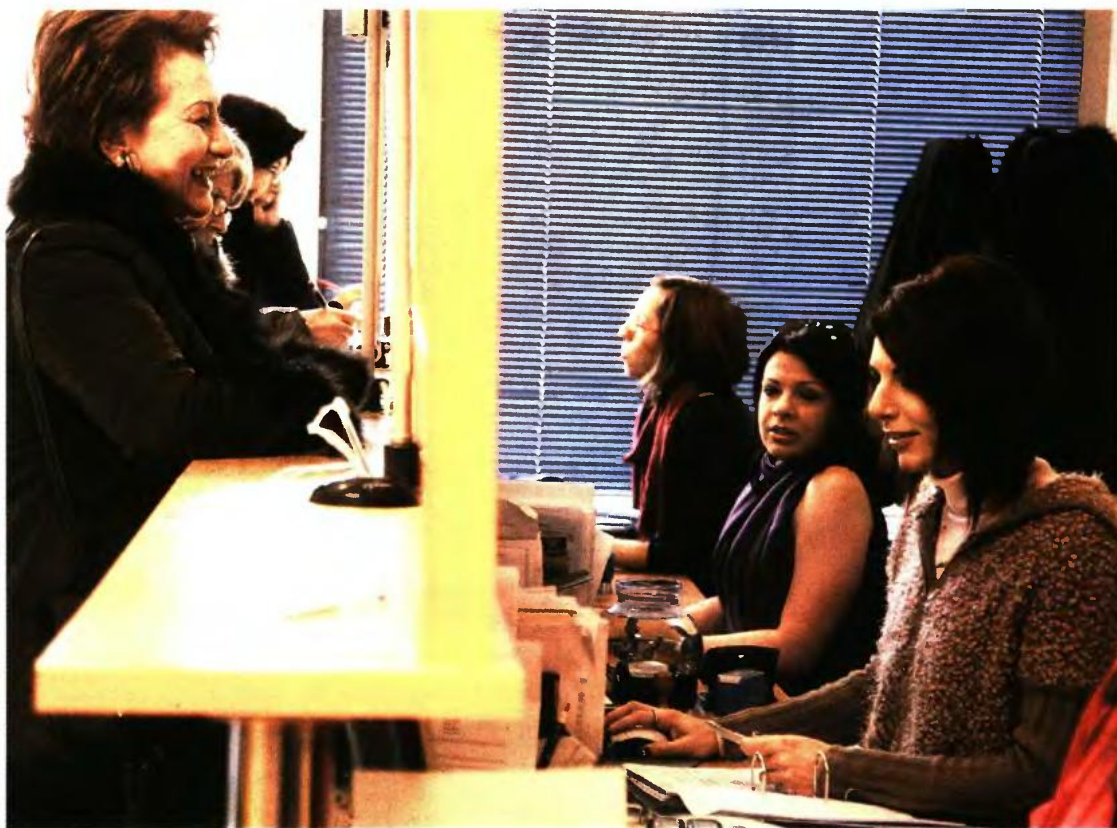
Χαμένες είναι οι γυναίκες που δεν πρόλαβαν να πιάσουν τα έτη ασφάλισης μέχρι τις 31 Δεκεμβρίου 2012

► Οι ασφαλισμένες του ΙΚΑ χωρίς ανήλικα τέκνα μπορούν να συνταξιοδοτηθούν από το 55ο έως και το 61ο έτος και 9 μήνες